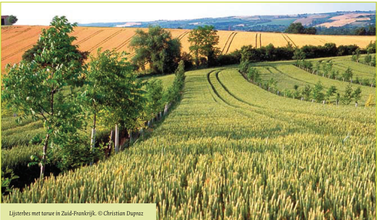
Lijsterbes met tarwe in Zuid-Frankrijk.

Een tweede belangrijke categorie bestaat uit edele houtsoorten zoals notelaar, tamme kastanje, boskers, robinia, ... Vooral notelaar en in mindere mate ook boskers bieden bijzondere potenties voor agroforestrytoepassingen in Vlaanderen. Beide produceren zeer kwalitatief hout, mits