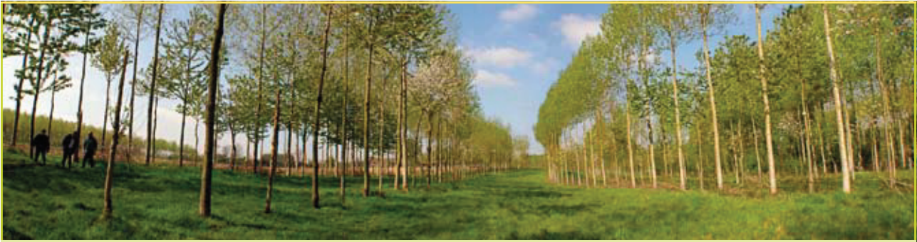
Een voorbeeld van een pionier in Vlaanderen: populier, boskers, en grasland. De eerste vijfjaar werd hier maïs tussen de bomen geteeld.

de stamvorm door snoei goed onderhouden wordt. De notelaar heeft als bijkomende voordelen de productie van noten, en het feit dat de bladeren zich relatief laat ontwikkelen en vroeg weer afvallen. Hierdoor wordt de lichtcompetitie met de tussenteelt minimaal gehouden. Ook tamme kastanje, lijsterbes en robinia zijn interessante, vergelijkbare boomsoorten.