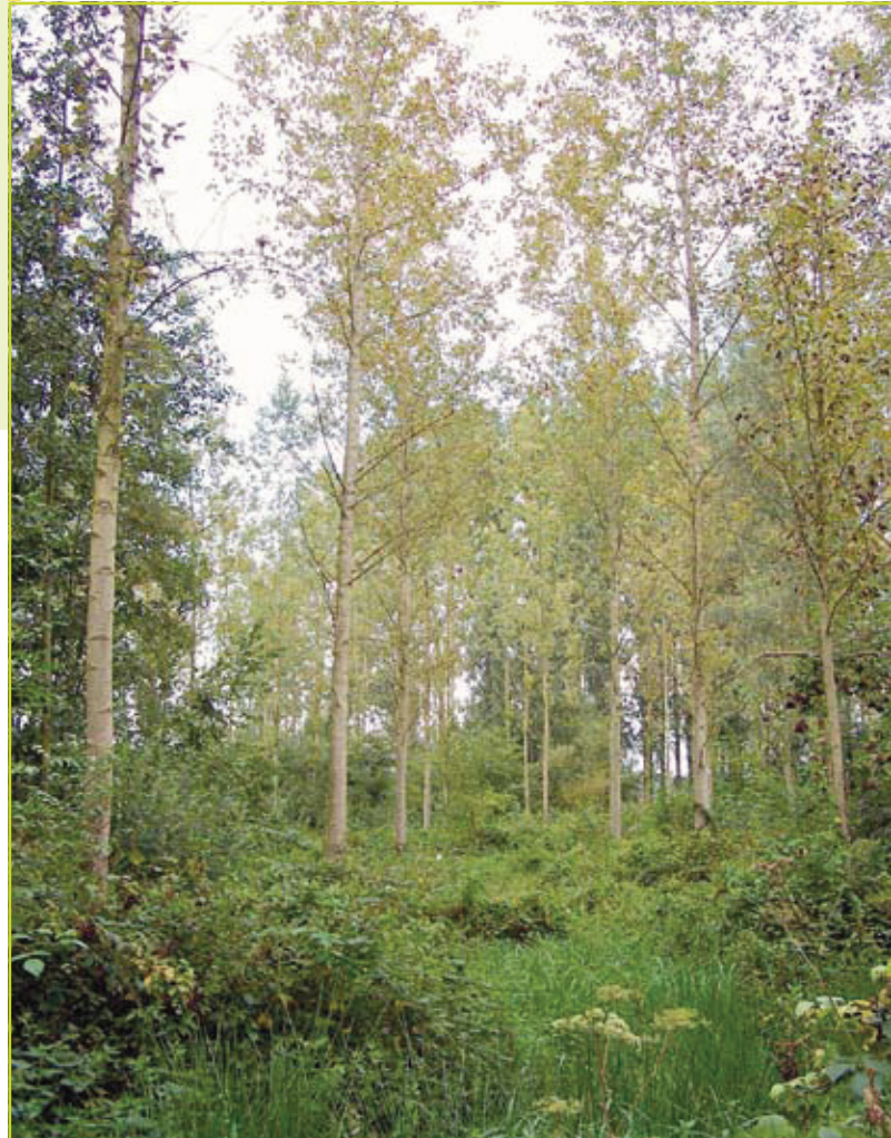
Figuur 1: Beeld van een 15 jaar oude herbebossing met populier.

CLINT CALLENS & KRIS VERHEYEN, Laboratorium voor Bosbouw, Universiteit Gent, Contact: Kris.Verheyen@UGent.be