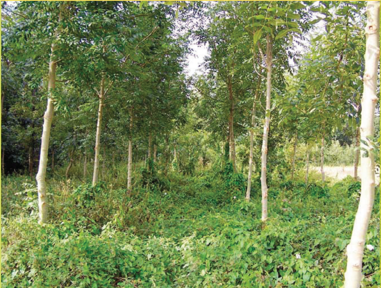
Figuur 3: Beeld van een 9 jaar oude herbebossing met es.

voldoende duidelijk. Hoewel er in het algemeen weinig kritische bemerkingen geformuleerd werden ten aanzien van de subsidieregeling stonden 78% van de bouseigenaars wel negatief tegenover het feit dat vanaf 2003 uitsluitend nog inheemse boomsoorten in aanmerking komen voor subsidie.