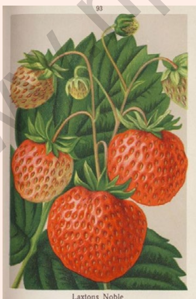
Laxtons Noble, de vruchten zijn identiek aan de Roem van Apeldoorn.

De humusrijke zandgrond hield goed vocht vast en was bijzonder geschikt voor groenteteelt en de teelt van kleinfruit. De teeltlaag reikte tot 60 cm diepte. Daardoor had men geen last van droogte in de zomermaanden. In totaal waren er zo'n 40 hectare aardbeievelden, waarop veel kleine bedrijfjes hun bestaan vonden. Er waren in 1952 ongeveer 259 bedrijfjes. De aardbeien werden aanvankelijk in de volle grond geteeld. In de jaren dertig ging men over tot de teelt in koude bakken onder platglas, waardoor de streek ook wel het ‘Westland van het Noorden’ werd genoemd. Verwarmde kassen werden niet gebruikt. De aardbeien werden geveild