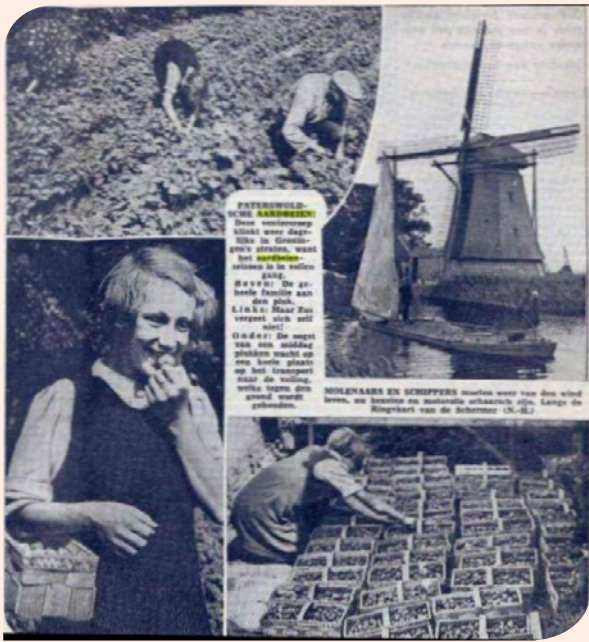
Paterswolse aardbeien krantenfoto's.

in koude bakken onder glas geteeld. Een zeer gezond ras. Het verschil met Laxton Noble zit hem eigenlijk alleen in de bladeren en de grootte