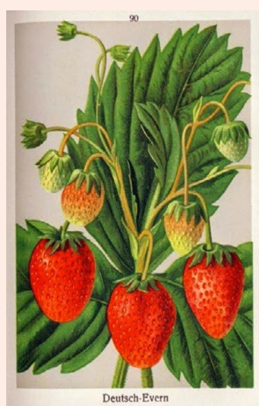
Aardbei Deutsch Evern.