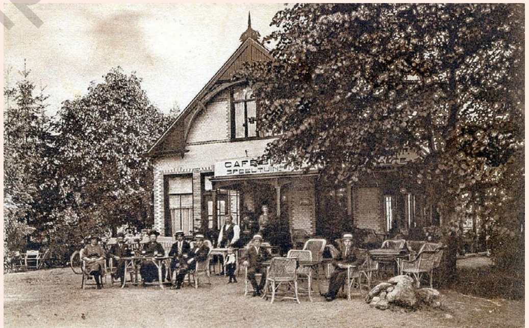
Café Braakzicht, waar de aardbeien geveild werden.

Na de oorlog is het assortiment vernieuwd met toen moderne rassen als Glasa, Gorella en Ostara, maar