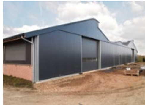
De stal met de bijzondere puntaken heeft Kurt zelf bedacht.