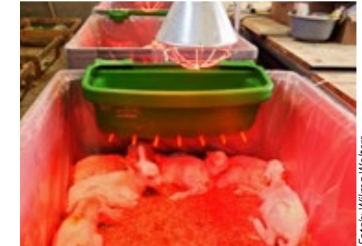
Nu zitten de lammeren nog in de loods, een opfokstal staat op het wensenlijstje.