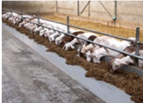
Als de voeraanschuifrobot langskomt, komen de dieren direct naar het voerhek.