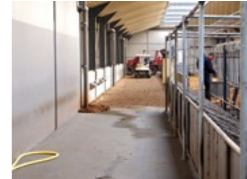
De terugloopgang van de melkstal is breed en zorgt zodoende niet voor oponthoud.