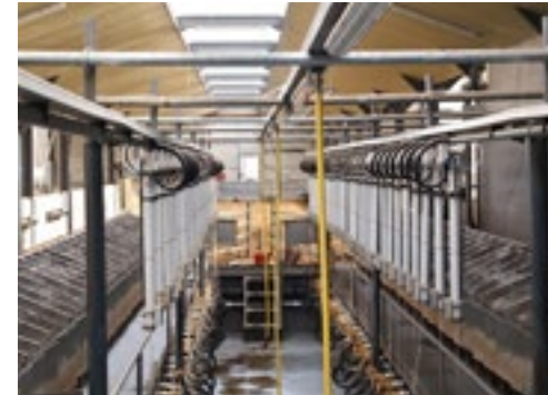
Door de lichtplaten erboven is er opvallend veel licht in de melkstal.