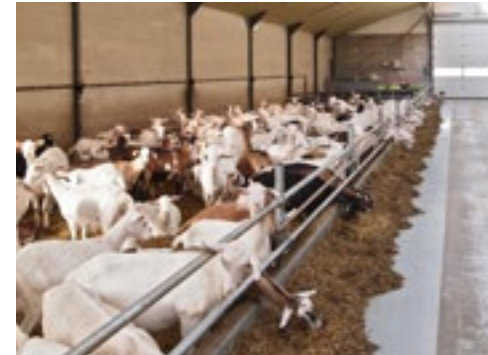
Er loopt ook wat 'kleur' in de stal om hogere gehalten te kunnen melken.