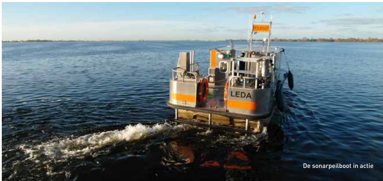
De sonarpeilboot in actie