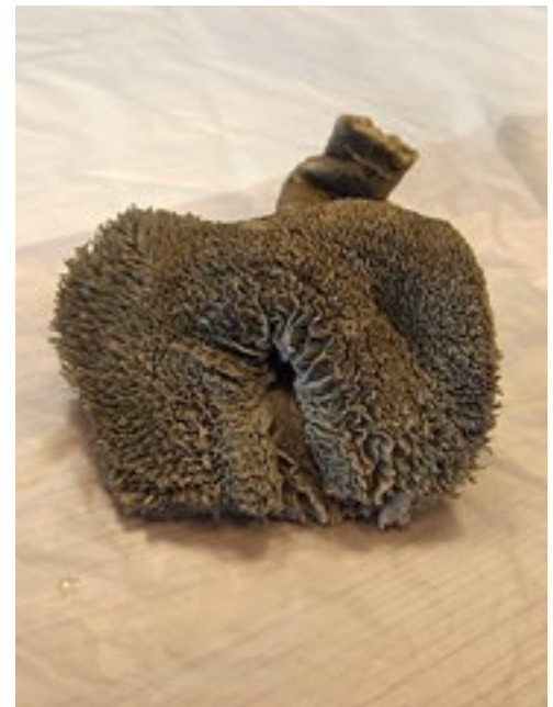
De slokdarmsleuf vormt alleen een sleuf als het lam de juiste reflex heeft.

De tweede voormaag, de netmaag, noemt Teeuw ook wel deeltjesfilter. "Door de netstructuur selecteert deze maag op deeltjesgrootte. Alles wat niet door het net past, perst de netmaag terug naar de pens om