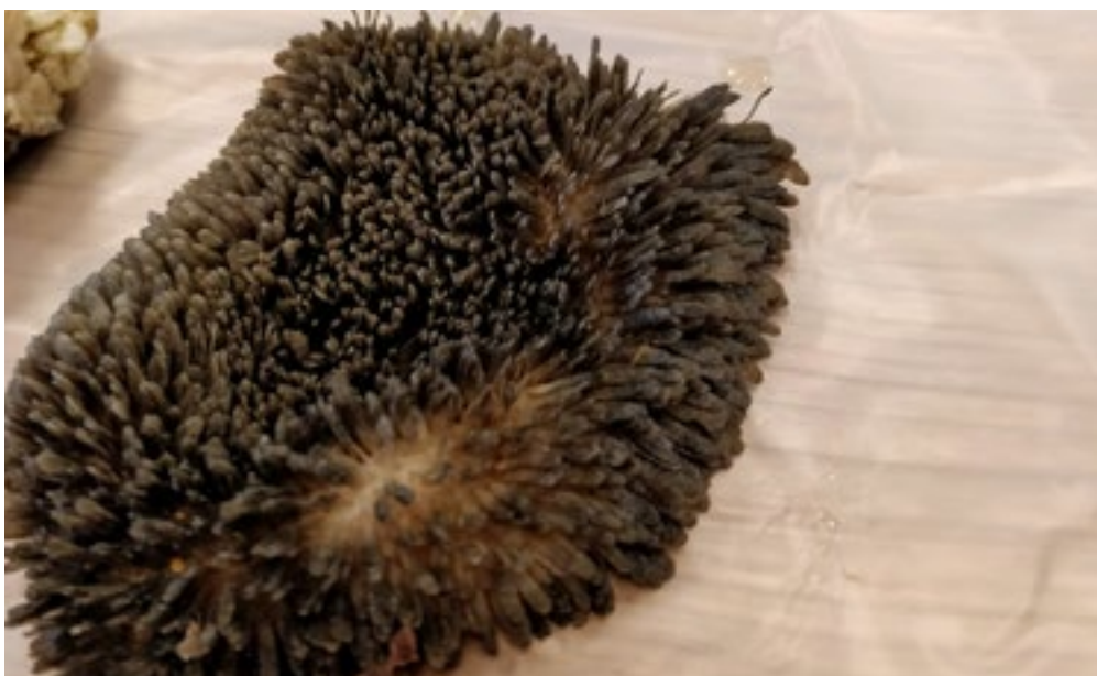
Hoe langer de penspapillen, hoe groter de opnamecapaciteit van de pens.

verder te vermengen en verkleinen, de rest kan door naar de volgende maag.”