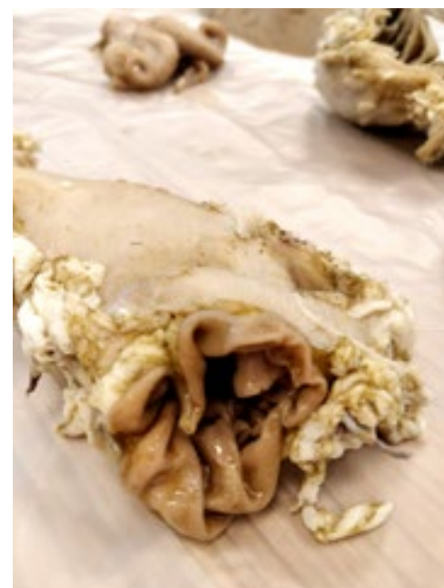
De slijmlaag in de darmen is goed zichtbaar.