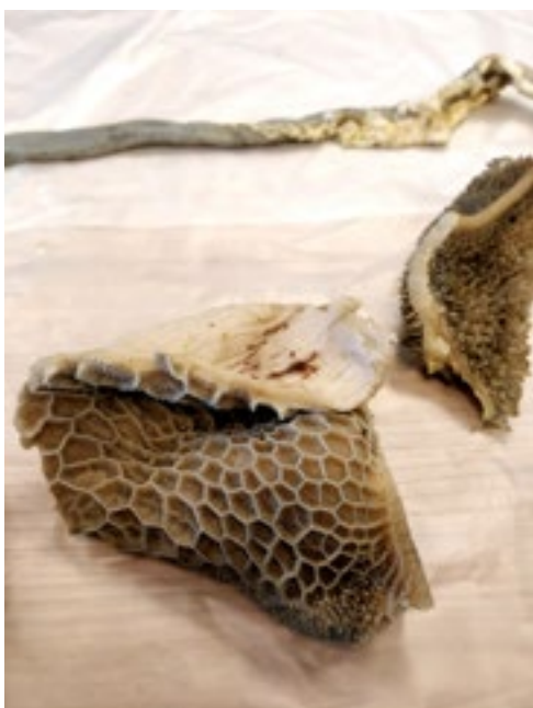
De netmaag fungeert als deeltjesfilter.

Teeuw: “Vooral bij meerlingdrachten neemt door ruimtegebrek de mogelijkheid om voldoende te eten af. De geit zal ook minder actief worden en liever blijven liggen. Als de opname onder de behoeftengrens komt, zal de geit haar reserves (vet en spieren) aanspreken en krijgt de lever het voor zijn kiezen om dit allemaal te verwerken. Een overbelasting van de lever met vervetting als gevolg is helaas niet zeldzaam. Dat heeft weer tot gevolg dat ook de andere functies, zoals het ontgiften en aanmaken van voldoende anti-stoffen (eiwitten), onvoldoende wordt.”