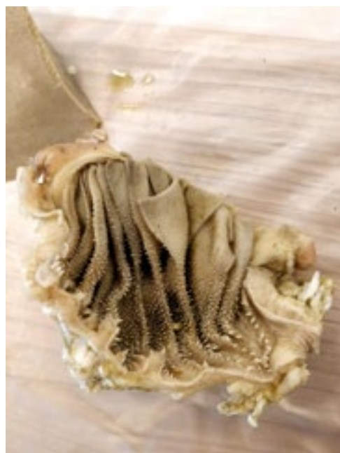
Een groot deel van het water in de voedselbrij wordt er in de boekmaag uitgehaald en is dan weer beschikbaar voor het lichaam.