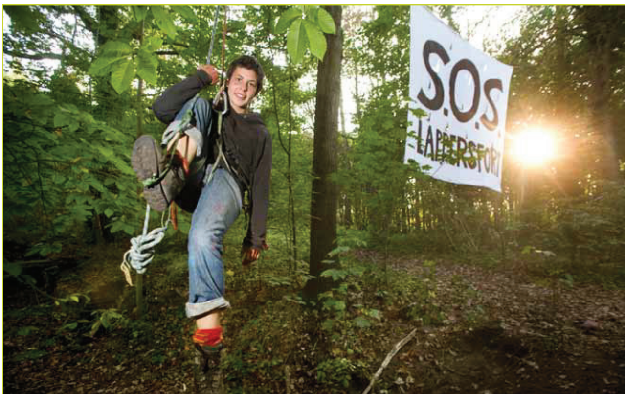
Het Lappersfortbos in Brugge was jarenlang hét symbool van de bedreigde bossen in Vlaanderen.

(vandaag BOS+) haar Reddingsplan Zonevreemde Bossen, waarin ze beleidsmakers een aantal constructieve voorstellen aanreikt om de meest waardevolle en bedreigde zonevreemde bossen afdoend te beschermen.