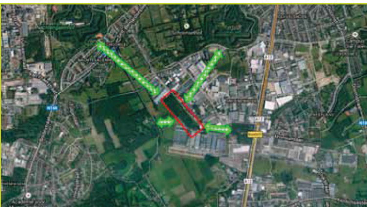
Het Ferrarisbos in Wilrijk is niet alleen een ecologisch zeer waardevol bos op zich, het is ook een belangrijke stapsteen tussen andere belangrijke natuurgebieden. En dit in een sterk verstedelijkte regio.

bestemming gehaald en ingekleurd als bedrijfszone, en de eigenaar – Essers NV – wil deze site nu te gelde maken door ze te ontbossen en er bedrijfsgebouwen te bouwen. Tien jaar na de eerste bezetting van het Lappersfortbos blijkt voorlopig weinig tot niets veranderd. Vervang “Lappersfort” door “Ferraris”, vervang “Brugge” door “Antwerpen”, en je kan letterlijk hetzelfde verhaal neerschrijven... Vandaag is dit schitterende bos het nieuwe symbool voor de vele bedreigde bossen in Vlaanderen. Door zijn bostype (eeuwenoud Ferrarisbos, inheems loofhout van grote dimensies met hoge aandelen staande en liggend dood hout, een bijzonder grote biodiversiteitswaarde en nabijheid tot andere belangrijke bos- en natuurgebieden) is dit bos een modelvoorbeeld voor de ecologisch waardevolle ruimtelijk bedreigde bossen die d.m.v. het aangekondigde plan van aanpak zouden moeten gevrijwaard worden van destructie.