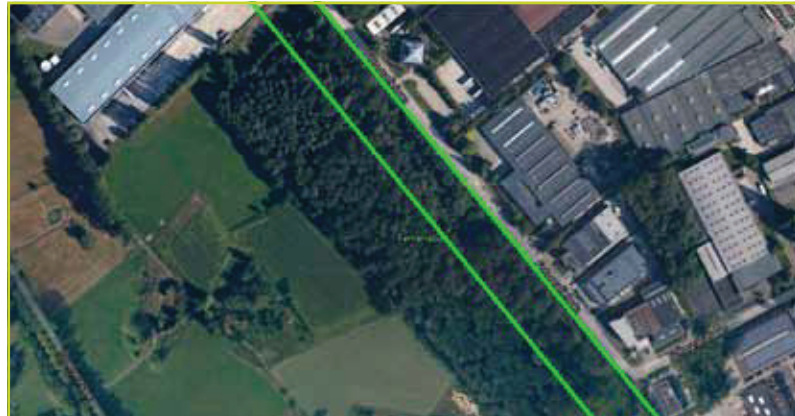
Het fabeltje van de planschade... Zelfs voor een langgerekte bos langs een goed uitgeruste weg, zoals het Ferrarisbos langs de Fotografiefilaan in Wilrijk, zou de planschade zich beperken tot minder dan de helft van de oppervlakte van het bos. De groene lijnen geven de afstand van 50m van de uitgeruste weg aan.

geschikt is voor bebouwing. Overheden kunnen zich hierop baseren om geen stedenbouwkundige vergunning af te leveren voor ontbossing.