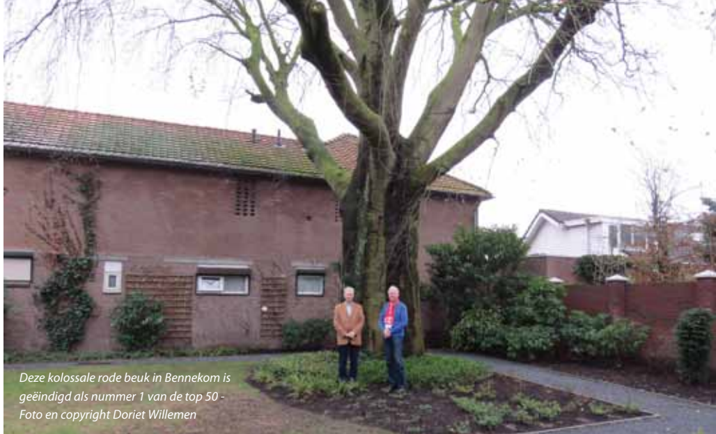
Deze kolossale rode beuk in Bennekom is geëindigd als nummer 1 van de top 50