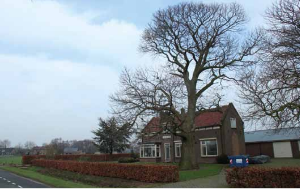
Monumentale tamme kastanje in het buitengebied van Lunteren.

relatief weinig particuliere waardevolle en monumentale bomen. Dat wil niet zeggen dat deze wijken niet groen zijn. In de nieuwbouwwijken Kernhem en Veluwe Poort in Ede zijn bijvoorbeeld wel veel gemeentelijke monumentale bomen aanwezig, doordat deze zijn ingepast bij de bouw van de wijk.