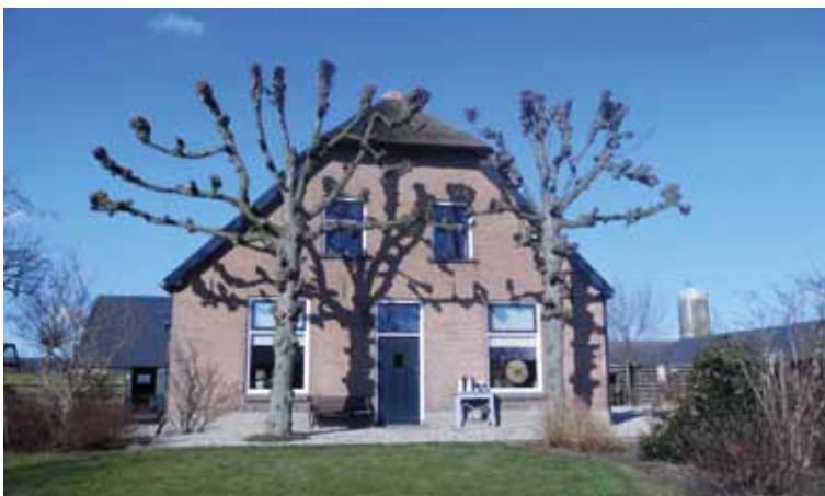
Oude cultuurhistorisch waardevolle leilinden voor een boerderij.

De rest van de bebouwde kom van Ede en Bennekom, vooral de wijken die zijn gebouwd na de Tweede Wereldoorlog, kenmerkt zich door