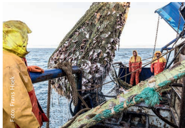
Visserij op platvis: het net wordt binnengehaald

In de private sfeer bestaan er vaker regels die betrekking hebben op het welzijn van vissen. Dat geldt bijvoorbeeld op het gebied van vervoer door de lucht voor de International Air Transport Association (IATA). Gedragsregels voor de sportvisserij worden verspreid door Sportvisserij Nederland en voor de dierentuinen via de Nederlandse Vereniging van Dierentuinen (NVD). Verschillende private georganiseerde keurmerken voor consumptievissen kennen regels op het gebied van het welzijn en ook de