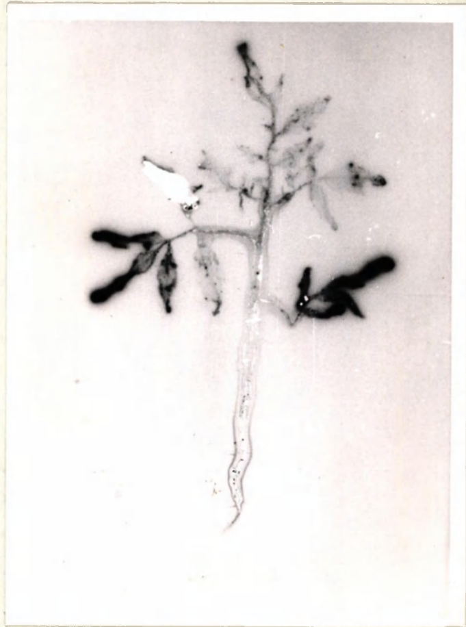
Behandeling 3 no. neg. 12695