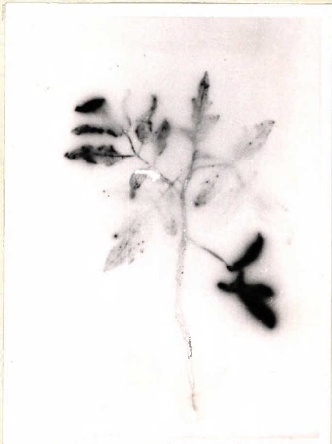
Behandeling 5 no. neg. 12694