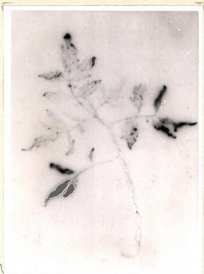
Behandeling 4 no. neg. 12696