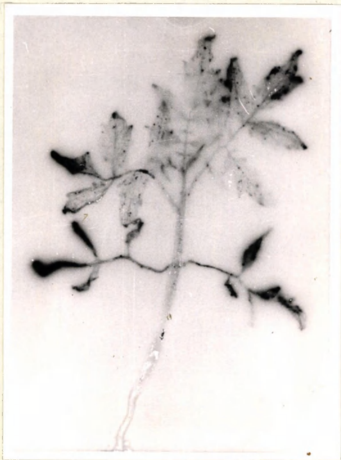
Behandeling 2 no. neg. 12697