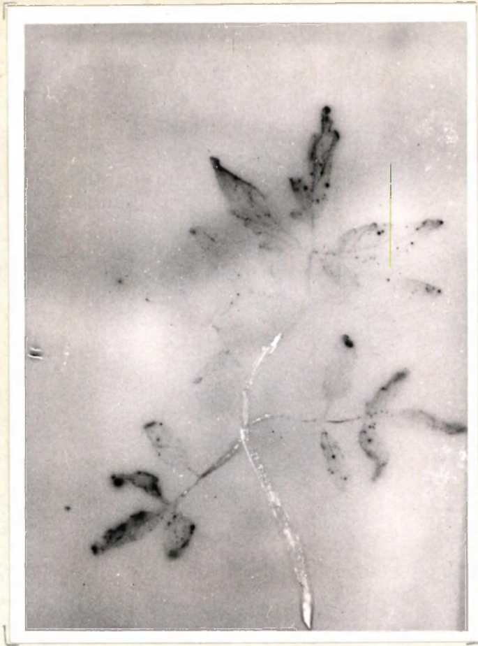
Behandeling 1 no. neg. 12693