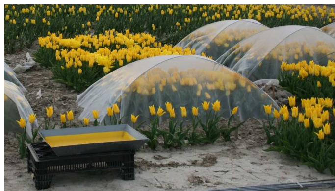
Figuur 2 Proefopstelling voor het bestuderen van vluchtgedrag van bladluizen en de verspreiding van tulpenmozaïekvirus in een proefveld.