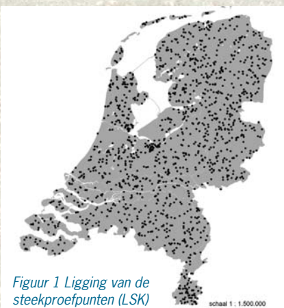
Figuur 1 Ligging van de steekproefpunten (LSK)

In het kader van de evaluatie van de Meststoffenwet 2004 is daarom nagegaan in hoeverre het mogelijk is om een indruk te krijgen van de mate waarin de Nederlandse landbouwgronden met fosfaat verzadigd zijn. Hiervoor is allereerst indicatief vastgesteld welke grenswaarde voor fosfaatverzadiging gehanteerd zou kunnen worden voor de verschillende grondsoorten. Vervolgens is aan de hand van bodemchemische kenmerken, die in de loop van de negentiger jaren zijn verzameld in het kader van de Landelijke Steekproef Kaartenheden (LSK; figuur 1), indicatief afgeleid welk areaal boven de norm ligt.