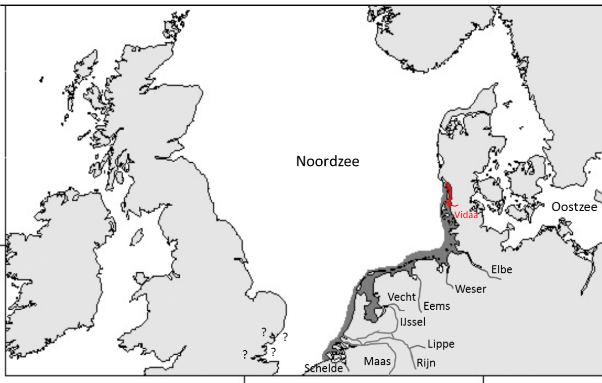
Figuur 1. Het historische verspreidingsgebied van houtingen in zee en belangrijke rivieren (donkergrijs) en de verspreiding rond 1985 (rood) rondom de Vidaa in het Deense Waddengebied (Naar Jensen et al. 2003, Hansen et al. 2005, en Jepsen et al. 2012). Nadien is de verspreiding van houting door uitzettingen in Sleeswijk-Holstein en het Rijn-stroomgebied weer groter geworden. Het historisch voorkomen van houting voor de Zuidoostelijke Engelse kust is onzeker.

In de loop van de 20ste eeuw zijn houtingen vrijwel overal verdwenen. In Nederland gebeurde dit in de jaren '30 van de vorige eeuw (de Groot 1988, 1990a, 1990b, 2002, zie ook figuur 2). Alleen in het Deense riviertje de Vidaa heeft zich een kleine populatie van enkele duizenden volwassen houtingen weten te handhaven (Jensen et al. 2003, Jepsen et al. 2012). In enkele kleine rivieren ten noorden van de Vidaa wordt, op zeer geringe schaal, af en toe natuurlijke paai waargenomen.