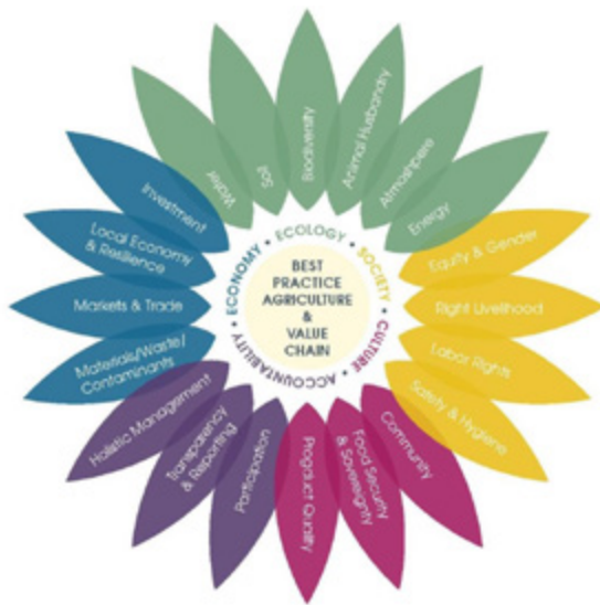
Figuur 1. IFOAM's duurzaamheidsbloem met de vijf dimensies: ecologie, maatschappij, cultuur, verantwoording en economie (Arbenz et al. 2016)