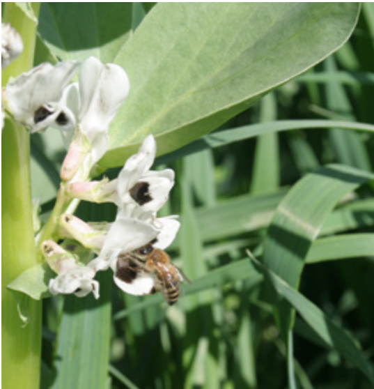
Foto 6. Bloemvorm van veldboon ( Vicia faba L.) moet toegankelijk blijven voor bestuivers.

Mijn collega's bij het LBI hebben gemerkt dat sommige klaverrassen om dezelfde reden worden genegeerd door bestuivers. Veredelaars moeten rekening houden met dergelijke bloemkenmerken, omdat onze voedingsgewassen ook voedsel voor bestuivers moeten leveren om zo bij te kunnen dragen aan ecosysteemdiensten.