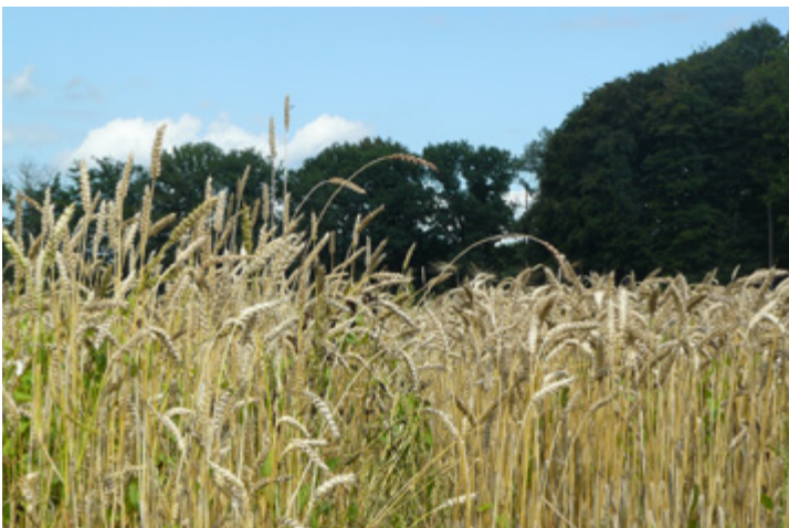
Foto 3. Links een populatie ras (composite cross population) versus zuivere lijn in wintertarwe (rechts).