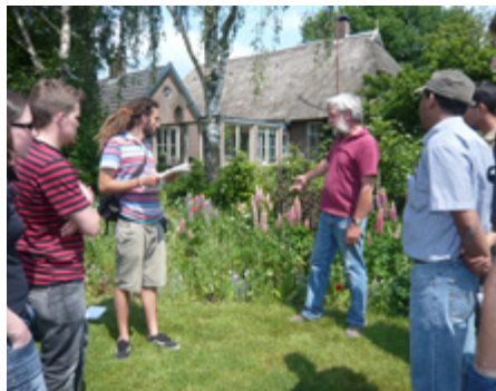
Foto 4a en b. Excursie naar Vitalis (foto links) en De Bolster (foto rechts) met MSc studenten van de cursus Organic Plant Breeding.