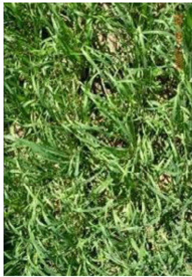
Foto's 2a en 2b. Verschillen in slechte (a) en goede (b) onkruidonderdrukking bij gerst.

Op verzoek van de biologische sector heeft Brussel een experiment toegestaan in verschillende EU-landen, waaronder Nederland, om te onderzoeken hoe dergelijk 'heterogeen materiaal', zoals het wordt genoemd, zodanig kan worden beschreven dat het onderscheidbaar wordt en legaal op de markt kan worden gebracht.