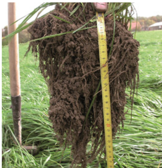
Foto 7. Sommige rassen produceren niet alleen een goede grasopbrengst, maar produceren ook een grote wortelbiomassa.

Deze uitdagingen kunnen niet alleen door technische oplossingen worden opgepakt, maar vereisen oplossingen die rekening houden met sociaal-economische, ethische en juridische aspecten. Daarom is een integrale aanpak nodig om de ecologische veerkracht in combinatie met de sociale veerkracht te versterken.