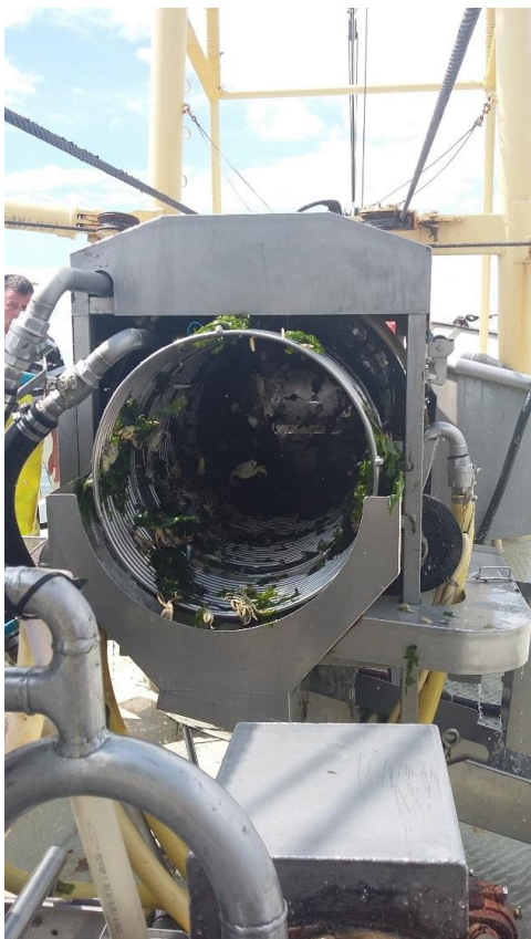
Stap 5. Sorteermolen (spoelzeef) waarin de garnalen van de bijvangst worden gescheiden.

In en aan de zeef blijft zeewier gedeeltelijk achter.