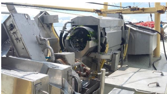
Dekmachines voor het sorteren van de vangst.

Een schematisch overzicht van de verwerkingslijn aan boord van een garnalenkotter, bestaande uit: (1) stortbakken, (2) opvoerband, (3) sorteerband, (4) transportgoot, (5) sorteermolen, (6) afvoergoot, (7) garnalenwelbak, (8) transportgoot voor de garnalen, (9) automatische kookketel, (10) spoelmolen, (11) uitzoekbak en visruimluik en het (12) stortkokerluik. De vis en de garnalen worden in de stortbakken (1) gestort. Daarna voert de opvoerband (2) de vis mee naar boven naar de sorteerband (3). De vis wordt hier door een bemanningslid gesorteerd en gestript. De garnalen en ondermaatse vis gaan door de transportgoot (4) en worden in de sorteermolen (5) gesorteerd en gespoeld. In deze molen worden de garnalen van de rest van de vangst gescheiden. De discards worden voornamelijk teruggespoeld in zee door de afvoergoot (6). De garnalen komen in de welbak (7); schelpjes en ander vuil kunnen hierin bezinken. Daarna gaan de garnalen door de transportgoot (8) de automatische kookketel (9) in en worden daar gekookt. De gekookte garnalen worden in het mandje geloosd. Als het mandje vol is, wordt deze door een bemanningslid in de spoelmolen (10) leeggegooid. De garnalen worden schoongespoeld en afgekoeld. Hierna worden de garnalen uit de spoelmolen gedraaid en in de uitzoekbak (11) gegooit. Eventueel vuil wordt hier nog verwijderd. Daarna worden de garnalen in de stortkoker (12) gestort.