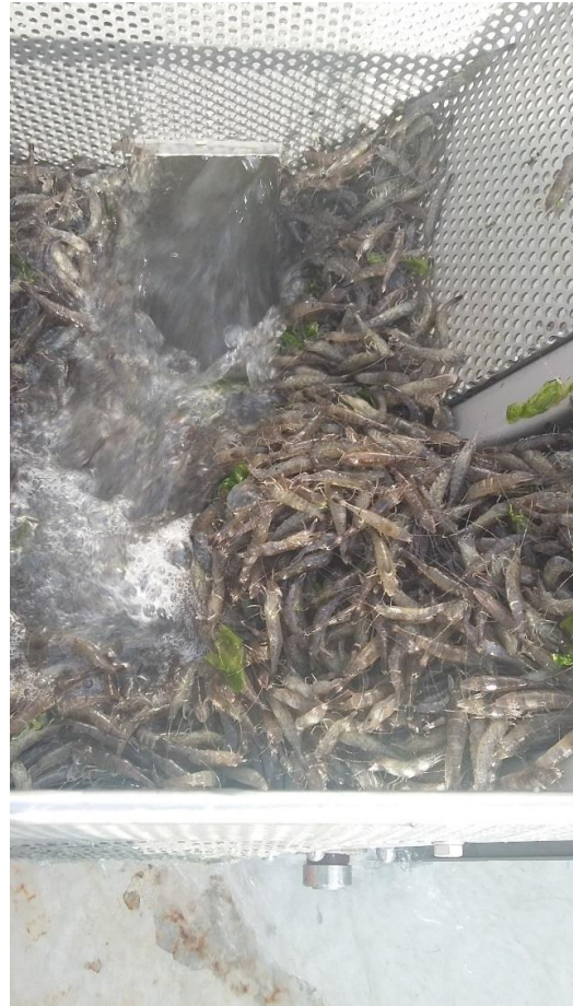
Stap 1. Stortbak met complete vangst.