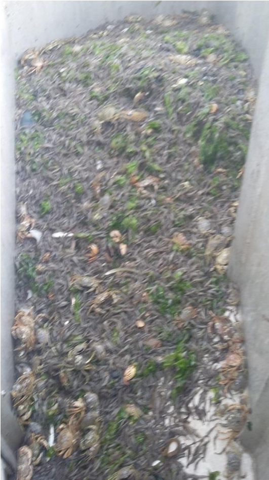
Stap 1. Stortbak met complete vangst.