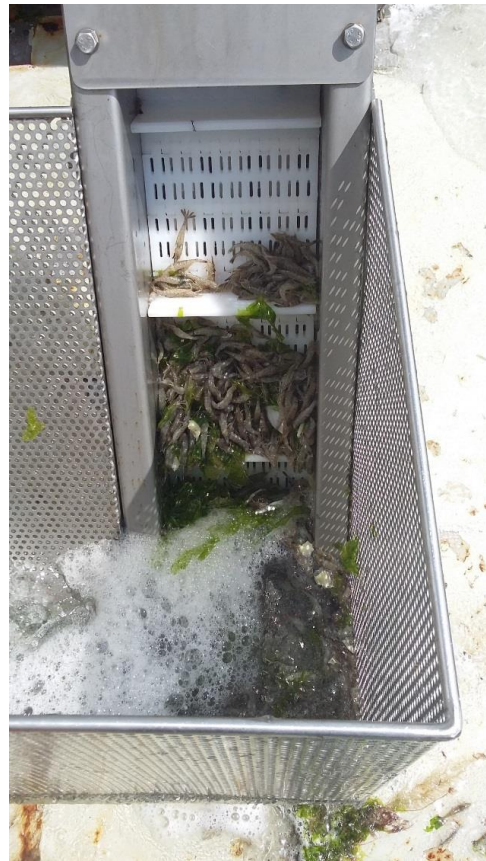
Stap 8. Transportgoot met gesorteerde garnalen die naar de kookketel gaan. Na passage door de sorteermolen is zeewier aanwezig tussen de gesorteerde garnalen.