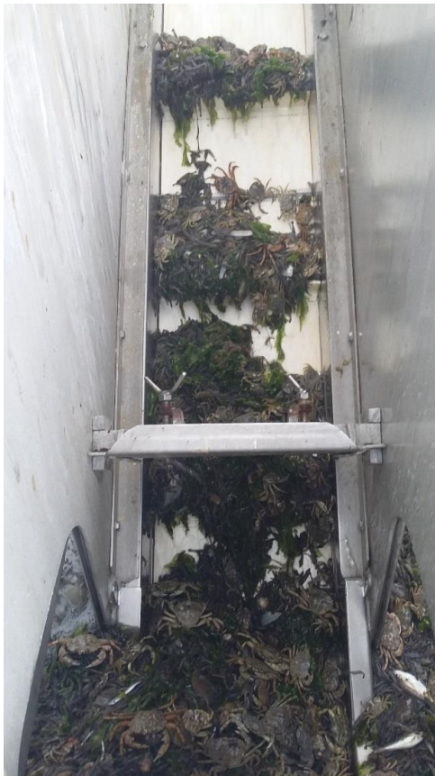
Stap 2. Opvoerband met complete vangst.