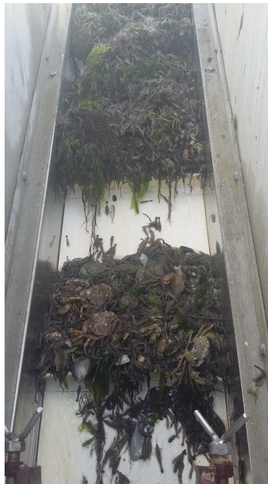
Stap 2. Opvoerband met complete vangst.