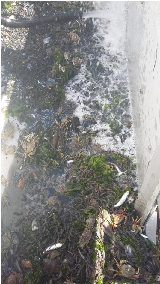
Stap 1. Stortbak met complete vangst.