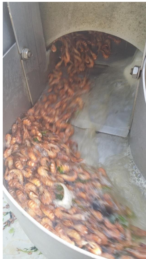
Stap 9-10. De gekookte garnalen komen uit de kookketel.

In en aan de zeef blijft zeewier gedeeltelijk achter.