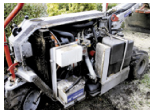
■ Ondanks de compacte bouw van de machine kun je goed onder de kap komen voor het (dagelijks) onderhoud.