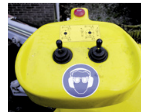
■ Het bedieningspaneel is erg eenvoudig met slechts twee joysticks en een stopknop.