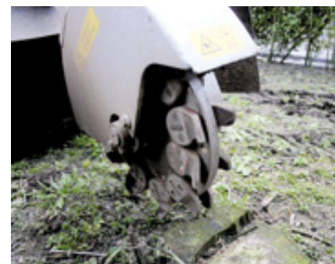
■ Het freeswiel van de SF 450 L. Deze is uitgevoerd met 24 messen.