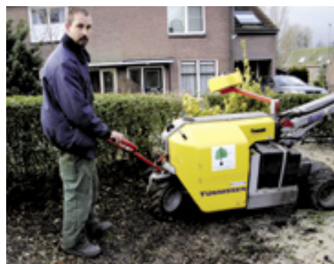
■ Wil je sturen met de machine, dan trek je de stuurboom naar links of rechts.