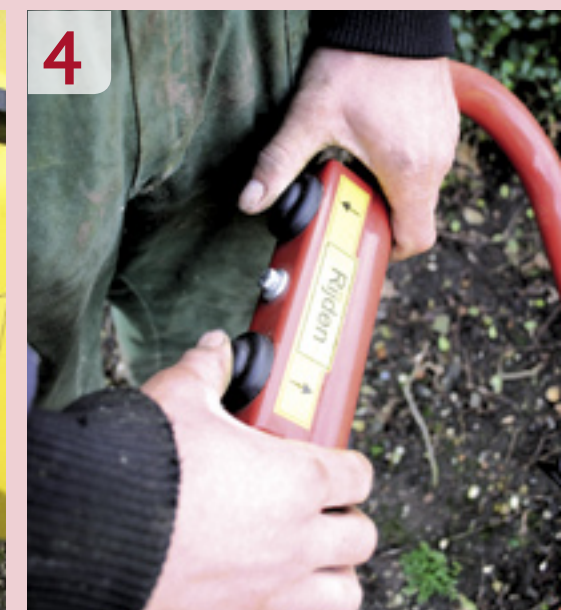
Bij de foto's 1 - 4