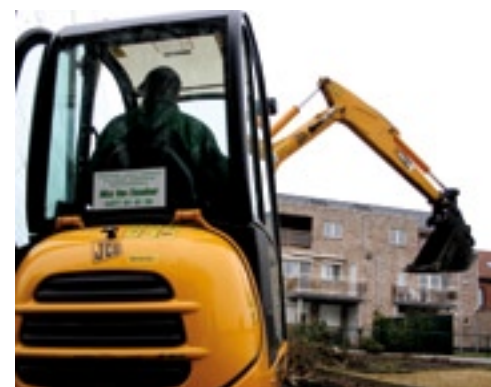
De giek kan zwenken wat handig is als je bijvoorbeeld langs een muur of hek moet werken.