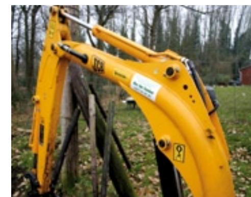
Opvallend: de ronde giek. Op de scharnierpunten na is hier niets aan gelast zodat niets aan sterkte hoeft te worden ingeleverd.