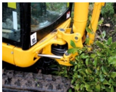
De zwenkgiek heeft naar links een maximale uitslag.

hiervoor de bovenwagen haaks op de rupsen en druk één van de rupsen omhoog. Vervolgens pomp je met een vetspuit net zoveel vet in de spanner als nodig is om de rupsen weer op de juiste spanning te krijgen. ■