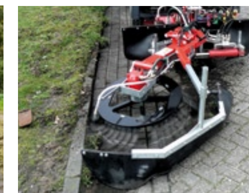
De Nimos borstelarm heeft een opengewerkte moederplaat waardoor je erdoorheen kan kijken.