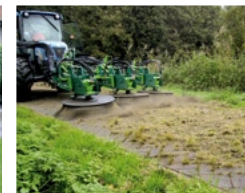
Voor hele grote terreinen is er de Maximo van Weed Control voor in de front van de trekker.