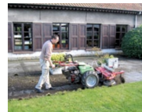
Lipco maakt een dubbele onkruidborstel voor eenassers.