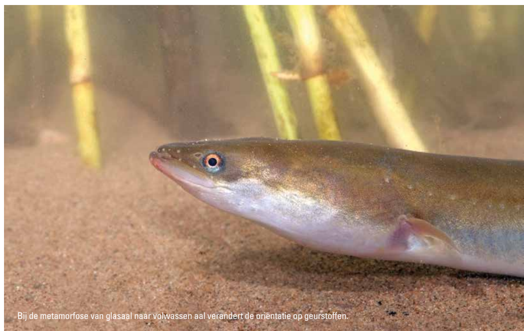
Bij de metamorfose van glasaal naar volwassen aal verandert de oriëntatie op geurstoffen.

Glasaal en jonge gepigmenteerde aaltjes lijken sterker te worden aangetrokken in water waarin soortgenoten hebben gezwommen dan in hetzelfde type water waarin geen paling heeft gezwommen. Het lijkt er dus op dat paling geurstoffen afgeeft die soortgenoten kunnen herkennen. Verondersteld wordt dat de aantrekkende werking niet heel sterk is en vooral zorgt voor aggregatie en samscholing van glasaal en jonge paling. De aantrekkende werking op grotere afstanden, zoals bijvoorbeeld tijdens migraties vanuit zee naar riviermondingen, is echter minder waarschijnlijk. Er zijn verschillende kandidaat geurstoffen gevonden die een aantrekkende werking hebben op glasaal en jonge gepigmenteerde aal in laboratoriumexperimenten: feromonen uit huidslim, galvloeistoffen en -zouten en specifieke aminozuren die als feromoon zouden kunnen werken. Het is zelfs aannemelijk dat op korte afstanden tot vijf meter geurstoffen van soortgenoten de efficiëntie van een vistrap voor glasaal en jonge gepigmenteerde aaltjes kunnen beïnvloeden.