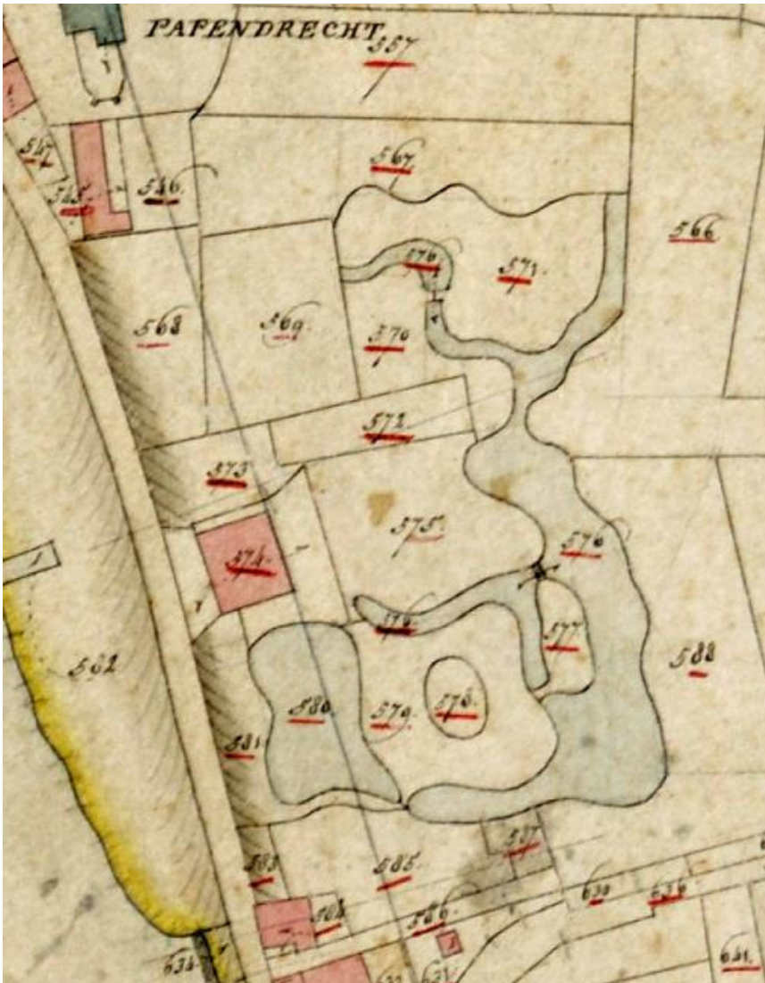
Afb. 1 Detail van het Kadastraal Minuutplan, Papendrecht sectie B blad 01 met Huis te Papendrecht [circa 1827] 566 weiland, 567 tuin, 568 boomgaard, 569 tuin, 570 bosch als lustplaats, 571 bosch als lustplaats, 572 tuin, 573 boomgaard, 574 huis en erf, 575 boomgaard, 576 vijver als lustplaats, 577 bosch als lustplaats, 578 boomgaard, 579 bosch als lustplaats, 580 vijver als lustplaats, 581 boomgaard, 582 bosch als lustplaats, 583 boomgaard, 584 huis en erf, 585 tuin, 586 erf, 587 weiland, 588 weiland.