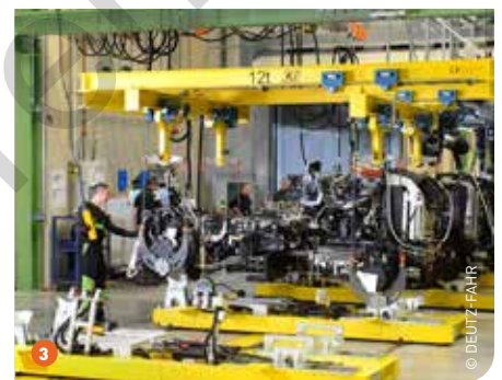
1 De band heeft een lengte van 360 meter en is sterk genoeg om tractoren van 20 ton te kunnen voortbewegen. 2 De tractoren worden gedurende meerdere minuten op mechanische, hydraulische en elektrische functies gecontroleerd. 3 Alvorens de tractor naar de lakafdeling gaat worden alle hydraulische functies onder de hoogst toegelaten druk getest.

nenauto's kan momenteel een test doorstaan van 120 uur zoutwater. De verfcabine moet het werk zeer efficiënt maken. Om aan deze tweede voorwaarde te voldoen, moet de tractor erg snel en veilig van de lopende vloer worden gehaald en in de spuitcabine terechtkomen. Een derde voorwaarde waaraan de constructeur in deze nieuwe fabriek kan voldoen, is het aspect milieuvriendelijkheid. Al het water en de verfproducten die in de fabriek worden gebruikt, zijn volledig te recycleren en zonder problemen herbruikbaar.