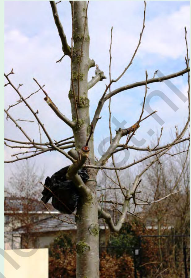
Geslaagde kroonenten van Rode Williams.