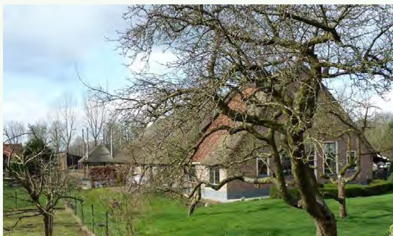
Hallehuisboerderij bij Eemnes.