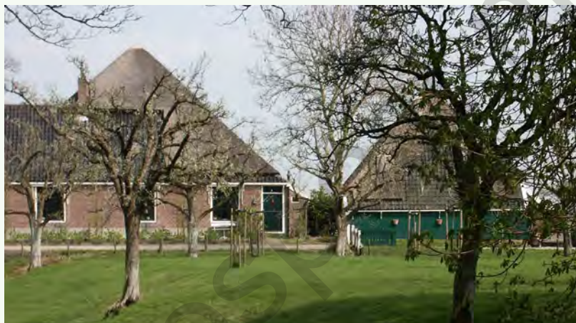
Boerenerf in Noord-Holland.

Boerderijen zijn niet compleet zonder erf. Het historische boerenerf was onderdeel van de traditionele manier van leven en werken op de boerderij en het platteland. De indeling was praktisch en sober. Nut ging voor de sier. Regionaal waren er grote verschillen door variatie in grondsoort, landschap, bedrijfstype