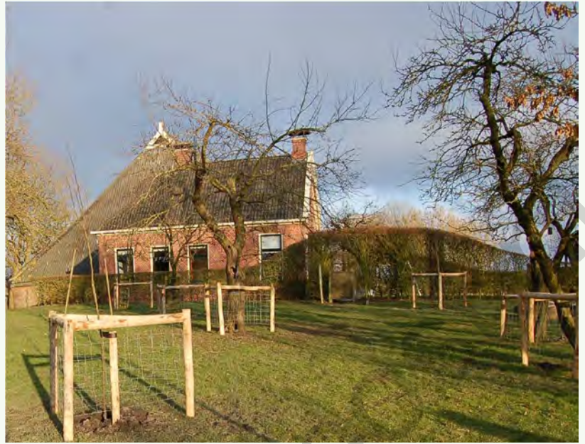
Boerenerv in Groningen met herstelde boomgaard.