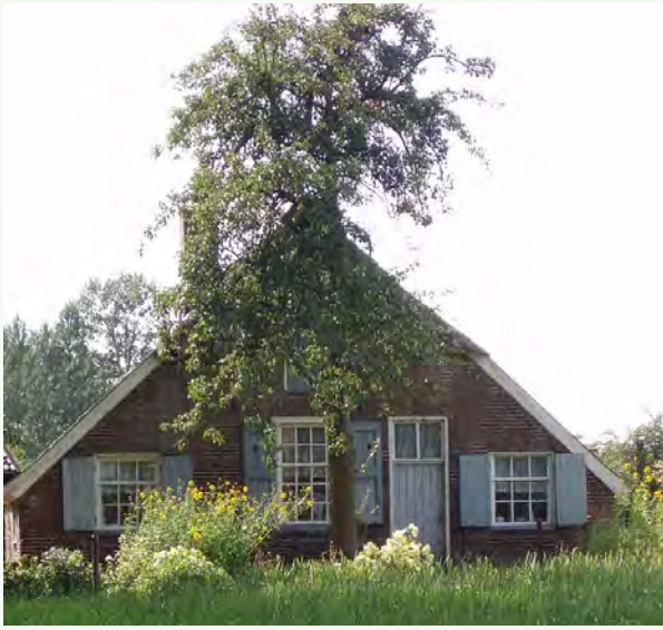
Oost-Nederlandse kleine hallehuisboerderij met oude perenboom.