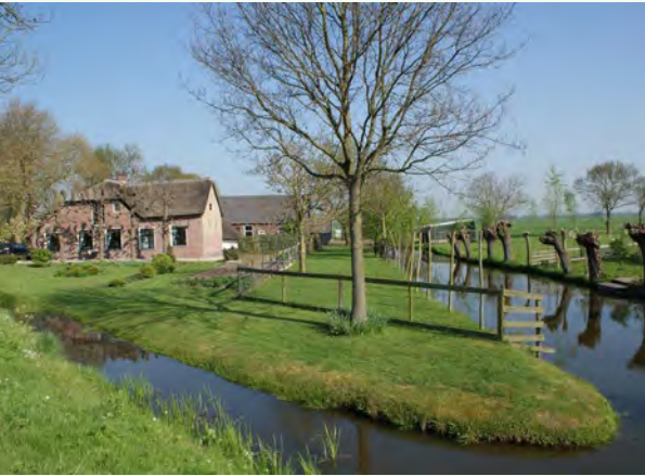
Boerenerv in Lopik (Utrecht).