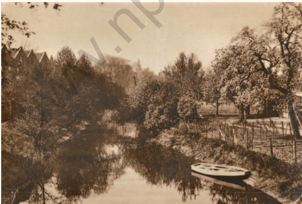
Buitengeluiden Zutphen Foto boomgaard Lijsen jaren 30.

Toen houthandelaar en fruitkweker Martinus Gerhardus Arnoldus Lij-sen (geb. 1858) in het begin van de vorige eeuw het perceel kocht, heeft