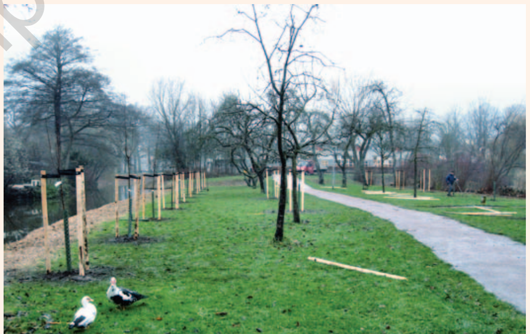
Het planten in december 2012. Bijna alle 27 nieuwe bomen staan erin.