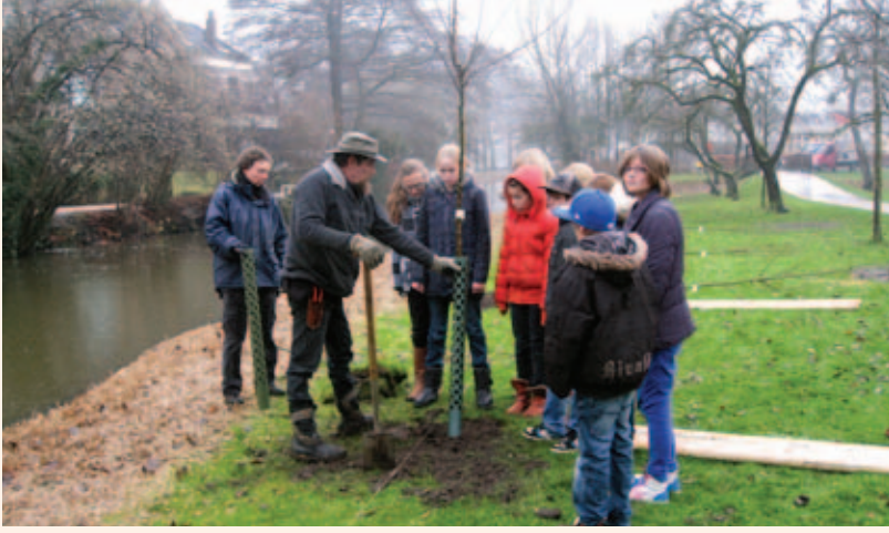
Kinderen van basisschool De Bongerd helpen met planten.

hij vermoedelijk direct de boomgaard aangeplant. Toen hij na enkele jaren de vruchten kon plukken verkocht hij tijdens de oogsttijd in de boomgaard het fruit aan de stadsbewoners. Na de dood van zijn vader in 1948 nam zijn tweede zoon en naamgenoot (geb.1900) het beheer over.