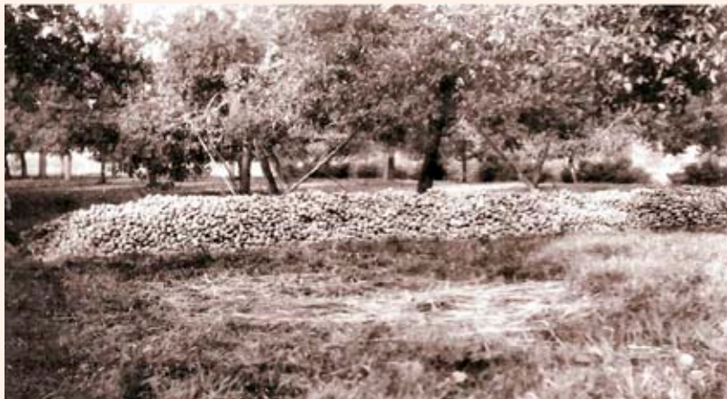
Present van Engeland uitgespreid.