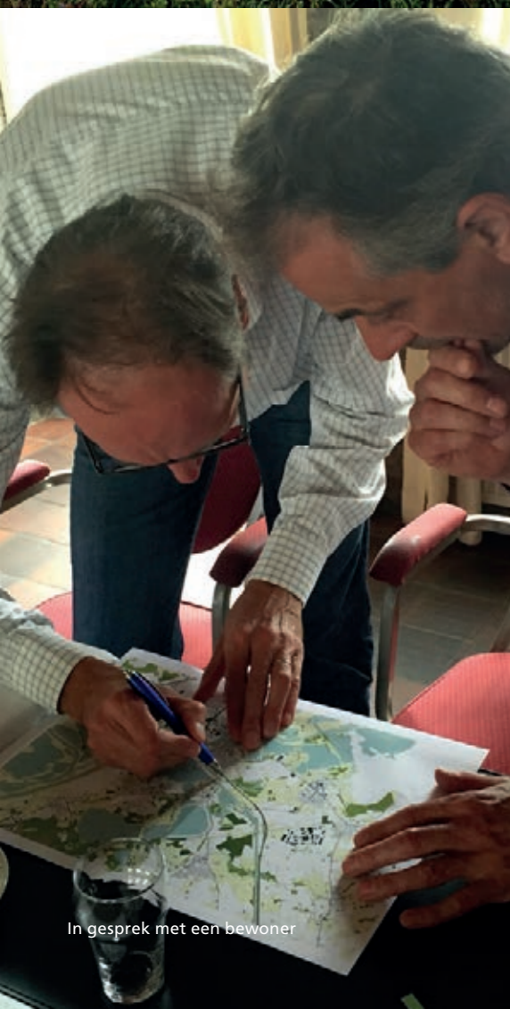
In gesprek met een bewoner