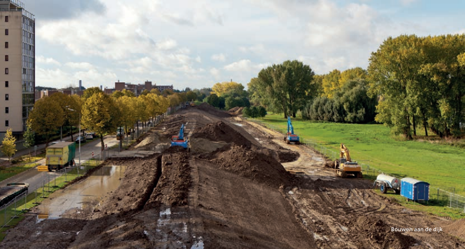
Bouwen aan de dijk