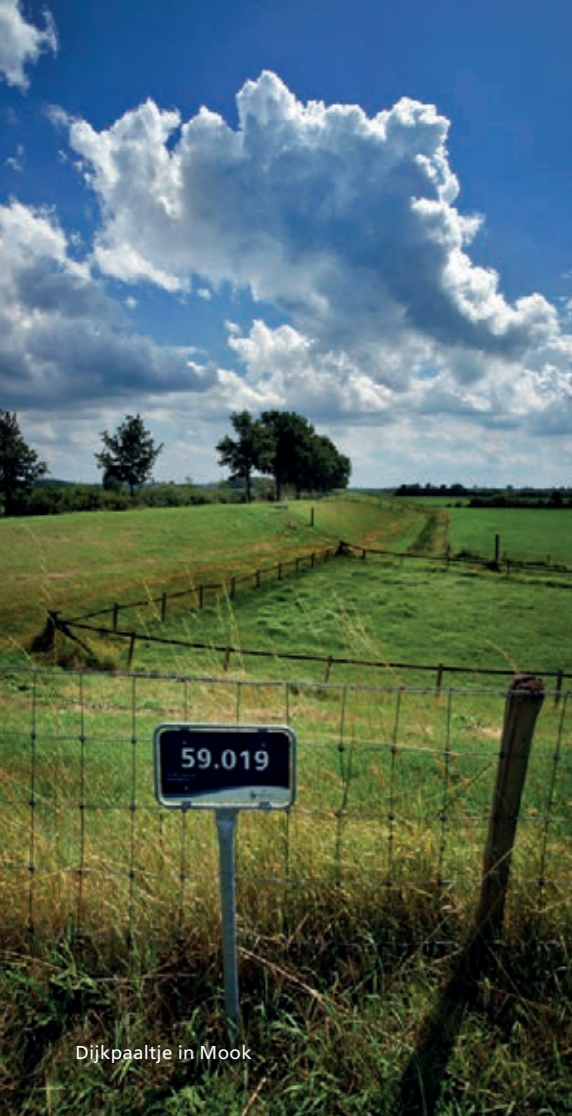
Dijkpaaltje in Mook