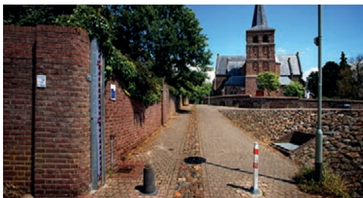
Harde dijk bij Mook

Waterveiligheid vinden wij allemaal belangrijk. Een uitgebreid netwerk van dijken beschermt Limburg tegen hoogwater. Ze lopen kilometers lang dwars door natuur, woongebieden, bedrijventerreinen of binnenstad. Overstromingen bij hoogwater zorgen voor grote maatschappelijke en economische schade. Door klimaatveranderingen en andere ontwikkelingen nemen de risico's toe en daarom moeten we onze dijken versterken: ze worden hoger en breder. Samen met partners in de omgeving zoeken we naar kansen om niet alleen de dijken maar ook andere gebiedskwaliteiten te versterken.