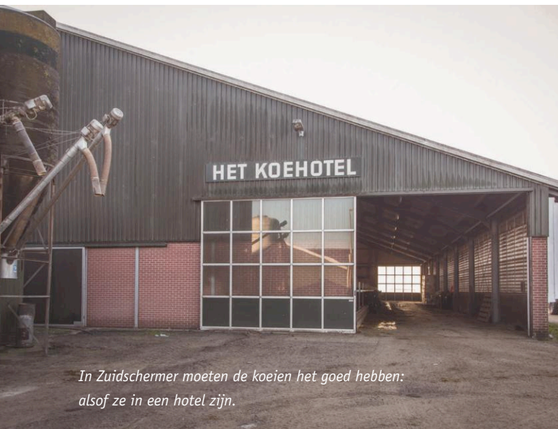
In Zuidscherner moeten de koeien het goed hebben: alsof ze in een hotel zijn.

per keer duurt. En dan is er ook nog het jongvee, dat op de andere locaties wordt opgefokt. Het jongvee vanaf negen maanden staat bij Sjoerds ouders in Markenbinnen. De drachtige vaarzen staan op een tweede locatie in Zuidscherner, waar dochter Else Kregel woont. Op die manier zijn er altijd minimaal drie mensen tegelijk aan het werk.