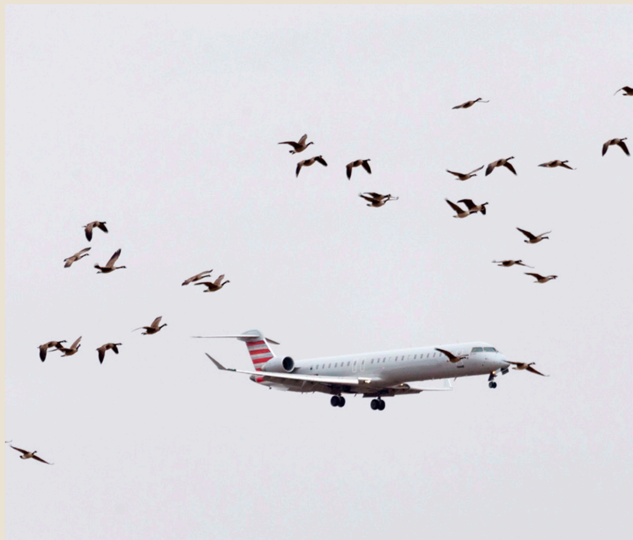
Vogels kunnen het vliegverkeer ernstig hinderen

want het advies is uiteindelijk een herijking van de praktijk die in de laatste vijftien jaar al onder hun verantwoordelijkheid was gegroeid.