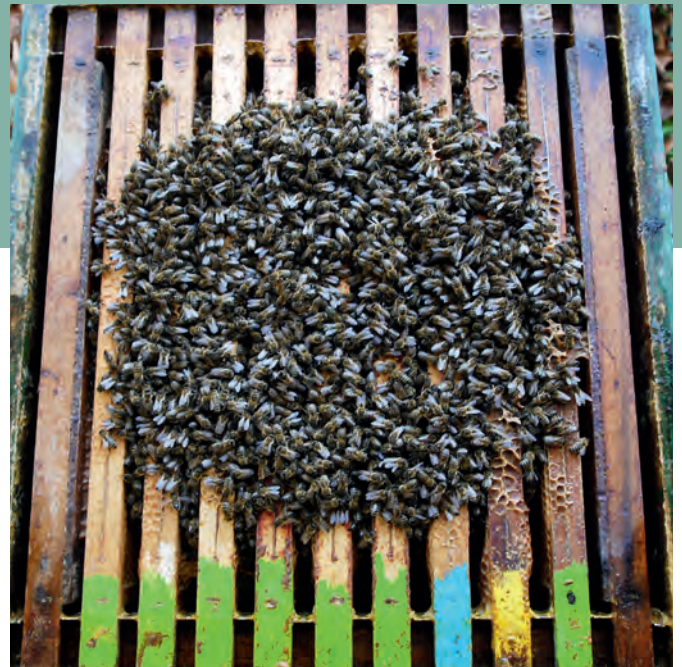
Beide foto's zijn gemaakt op 12 maart bij een temperatuur van 12°C. Beide volken staan op een broedkamer. Elke imker weet welk bijenvolk in mei het grootste broednest zal hebben, ook al zal het kleine volk per bij wat meer broed aanzetten.