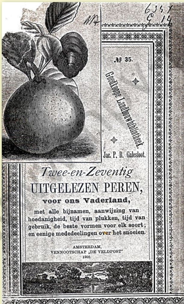
Brochure 72 peren.

Men neme echter wel in aanmerking, dat ik deze vormen alleen aanbeveel voor bomen, op kwee geënt. Immers, zijn zij geënt op wilde peer (zaailing), dan behoort men ze grotere vormen te geven, zoals enkele en dubbele palmet, enz.