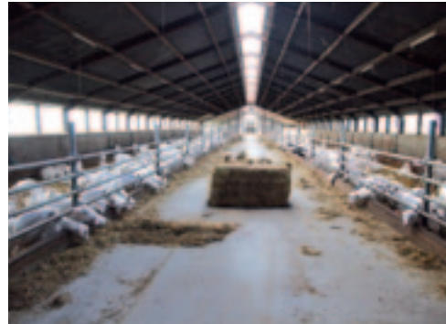
Ron heeft de bestaande stal verlengd om de opfokdieren te kunnen herbergen.