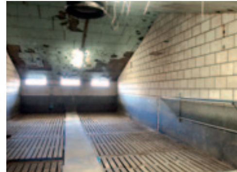
De oude varkensstal is, ook door Ron zelf, omgebouwd tot lammerenopvang.