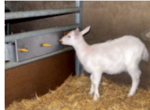
De lammerenopvang is voorzien van een drinkautomaat, hooiruif en voergoot.