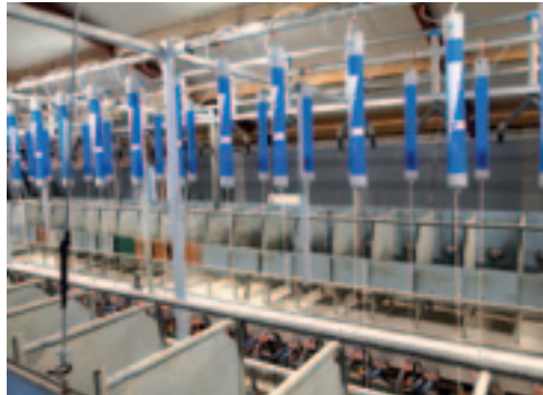
Na enige uitleg van de installateur, bouwt en maakt Ron de melkstal merendeels zelf.