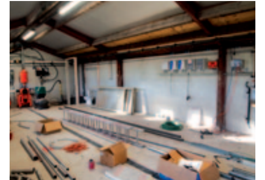
Eerste week januari zag het melktanklokaal er nog zo uit. Ondertussen is het klaar.