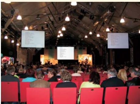
Plattelandsparlement in Zweden van 31 maart - 2 april 2006