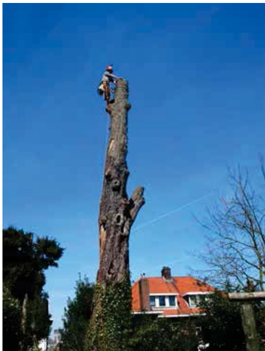
Foto 6 Afblokken van hoofdstam zonder rigging

Het mooie aan onze vakgroep is dat deze zeer toegankelijk is en dat iedereen bereid is elkaar, tot op zekere hoogte, te helpen. De drijfveer van de KPB is kennisdeling, dus wanneer je bij een dergelijke klus betrokken raakt en het voelt niet helemaal goed, durf de hulp in te schakelen van een andere (meer ervaren) boomverzorger. Twee weten meer dan een en het kan je soms tot hele nieuwe inzichten brengen.