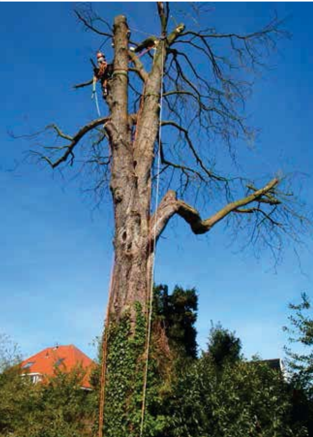
< Foto 5 Opzet van klim- en vangstysteem