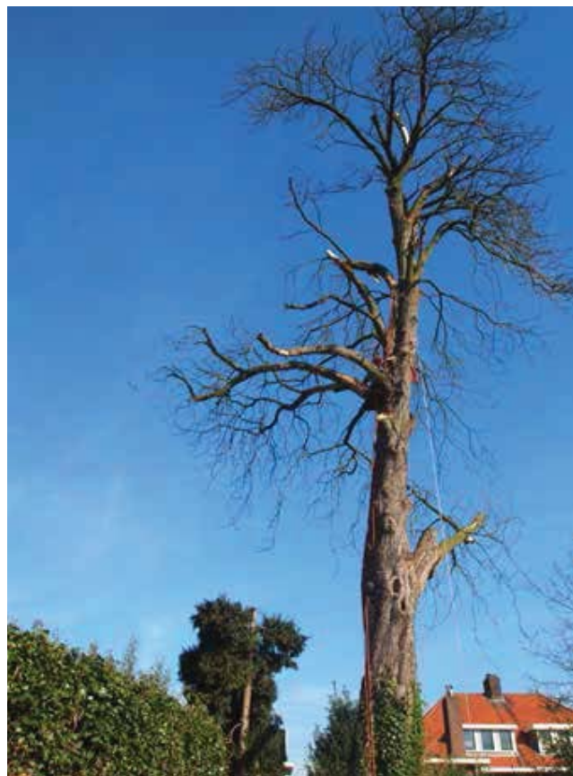
Foto 2 Afvangen van onderste takken