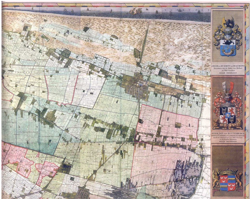
Figuur 2: Uitsnede uit de kaart van de gebr. Kruikius

In fysiek en sociaal opzicht kan de ontwikkeling van kernen worden gekarakteriseerd als de stad in het land. Een prachtige illustratie biedt de afbeelding van Delft, Den Haag, Rotterdam, Schiedam en Vlaardingingen op de kaart van Delfland, schaal 1:10.000 van de gebroeders Kruikius van rond 1710. Steden en dorpen zijn als het ware eilandjes in een zee van agrarisch land.