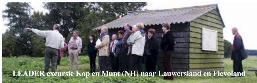
LEADER excursie Kop en Munt (NH) naar Lauwersland en Flevoland

We gaan in op de volgende thema's: van goed idee naar project; Leadermethode; leerpunten gebiedsgericht werken; bottum up en top down—versterken die elkaar? versterken fysieke, sociale en duurzame doelen elkaar? In workshops worden cases uit de praktijk aan de orde gesteld. Tot 28 november?!