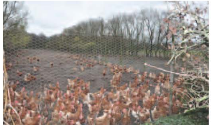
Foto 14: Zelfde open ruimte als Foto 13 maar rustiger gedrag bij bewolking

Er is een duidelijk verschil zichtbaar in uitlopen waar er een strook begroeiing is die kan gebruikt worden als transit zone (Foto 13 versus 15).