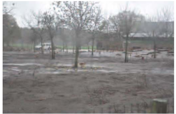
Foto 11: Hevige neerslag; de weinige kippen die buiten zijn, vluchten terug naar binnen

Neerslag heeft een grote invloed op het gebruik van de uitloop. Een befaamde weerspreuk zegt: "Als de kippen schuilen gaan, houdt het regenen zelden aan"; bij felle buien gaan ze binnen, bij lichte motregen – die lang blijft duren – blijven ze buiten. En inderdaad, in de praktijk zien we ook dat bij lichte regen de kippen nog vlot buiten komen; eens ze echter volledig nat zijn, gaan ze terug naar binnen. Bij erge regen zijn er maar enkele hennen buiten of vluchten ze snel terug naar binnen. Bij erge regenval zie je enkel nog wat kippen waar er beschutting beschikbaar is.