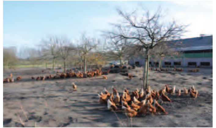
Foto 20: Kale boom in winter geeft beperkte schaduw maar geen beschutting