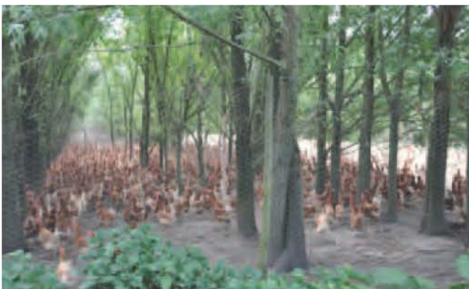
Foto 8 en 9: Natuurlijk windscherm