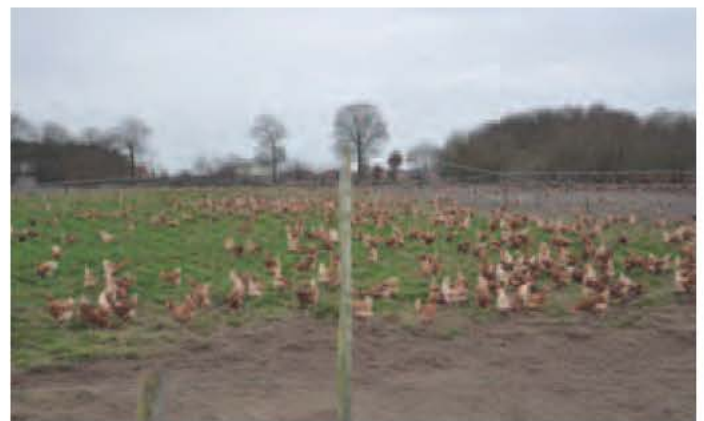
Foto 18: Dezelfde open ruimte als in Foto 17 bij bewolking in winterperiode