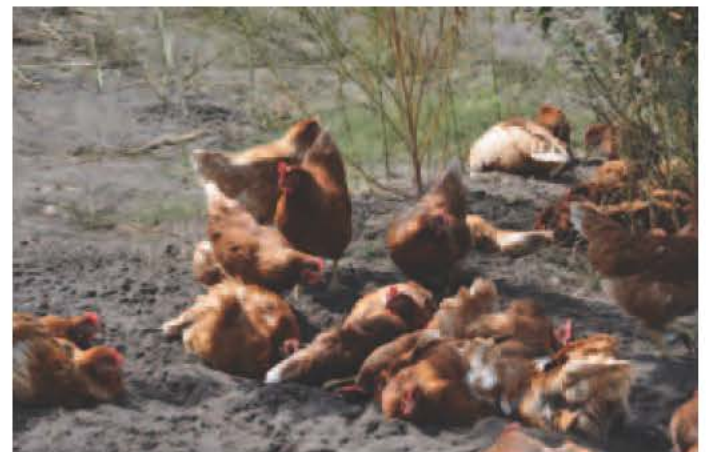
Foto 3 en 4: Zonnebaden