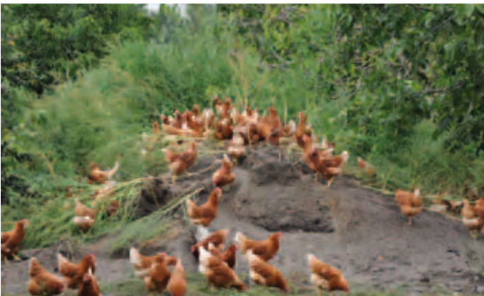
Foto 21: Zandheuvel met begroeiing zeer aantrekkelijk voor kippen in zomer