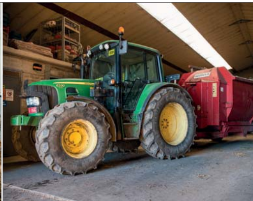
Het rantsoen wordt gemengd