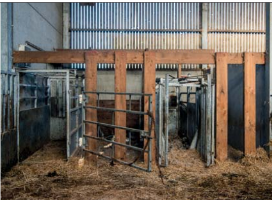
Een zelf gemonteerde behandelbox