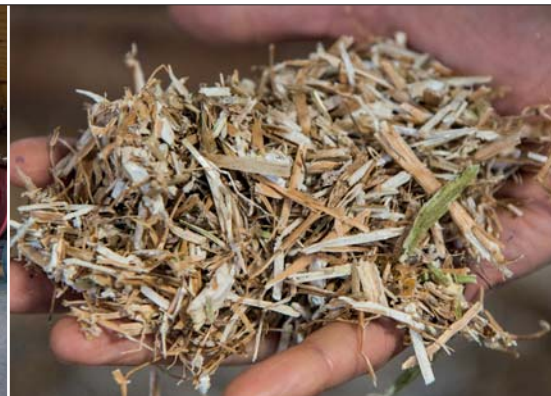
Pensprik en structuur bij de jonge kalveren