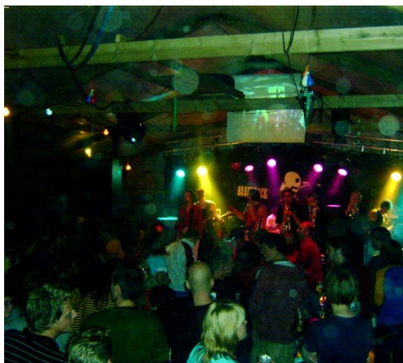
De "Hein & Diny Musichall op Broekrock

Er is op het platteland in Overijssel echt een bandjescultuur. Veel van die bandjes maken eigen nummers. De meeste mensen willen bekende nummers horen, dus ze kunnen niet zo vaak optreden. Dat kan wel op Broekrock. We krijgen nu ongeveer 100 of 200 aanmeldingen. Iedereen komt gratis spelen. De toegang is gratis, het is vrij, creativiteit, ruimte voor spontane dingen. Het is een vrijstaatidee. Je kunt ook niet zien wie er van de organisatie is. Normaal heeft een liedje: "Bij ons kan alles op de boerderij", en dat is precies de sfeer van Broekrock. Er zijn Broeklanders die graag naar Broekrock komen, er zijn er ook die er niets van moeten hebben. Maar veel mensen zijn dolenthousiast: "Broekrock is het mooiste wat er is" staat er bijvoorbeeld na afloop op de website. Er is een Broekrock-gemeenschap ontstaan van ongeveer 400 mensen. De mensen komen voor de bands, maar de hele entourage, met theateracts, de spontane dingen en de sfeer is net zo belangrijk.