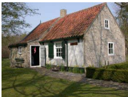
Duinhuysje te Rockanje

Als je iets begint, en je krijgt geen concreet eindresultaat, dan zit er iets mis. Je moet er vorm aan kunnen geven. Als ik aan iets begin dan weet ik zeker dat er iets uitkomt.