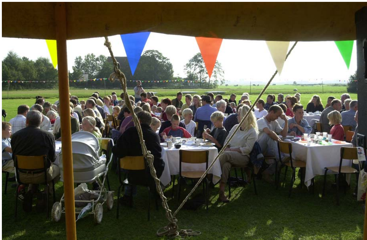
Dorpsontbijt in Kûbaard

We begonnen met 'het koffieuurtje van Kûbaard' in het Dorpshuis, en dat werd een enorm succes. Al gauw kwam de burgermeester officieel op bezoek, later de Commissaris van de Koningin, en nog weer later zelfs de koningin. Daarvoor moest een nieuw toilet worden aangelegd, dat heeft nog wat extra geld in het laatje gebracht...! Toen kwamen er al gauw gemeenteraadsverkiezingen. Toen we daarmee aan de gang gingen waren de lijsten al vastgesteld, en op die lijsten vonden we twee mensen uit Kûbaard, namelijk nummer drie van de PvdA en nummer zestien van het CDA. Toen hebben we in Kûbaard een stemming gehouden en daaruit kwam dat het de CDAer moest worden. We spraken af dat iedereen in Kûbaard, van welke partij dan ook, op die man zou stemmen. Alleen, daarmee haalden we de kiesdeler niet. Dus toen zijn we in mijn Eendje met een megafoon een aantal naburige dorpen langsgegaan om campagne te voeren. En dat lukte, hij werd gekozen. Zo hadden we een voorvechter voor de kleine dorpen in de gemeenteraad.