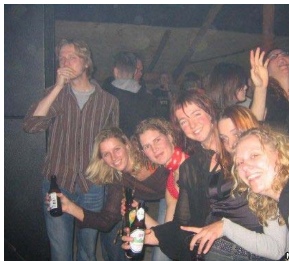
Bezoekers van Broekrock

We zijn met een illegaal feest begonnen. Op een gegeven moment wilden we het officieel aanpakken. Dat gaf eerst best wat problemen met de gemeente, het was vlak na Volendam. Nu zijn de contacten met gemeente, politie en brandweer goed. Je weet onderhand welke risico's je neemt. Je wordt minder onbevangen. We zijn ook een klein beetje verambtelijkt. We zijn een stichting, krijgen wat subsidie, we zijn verzekerd.