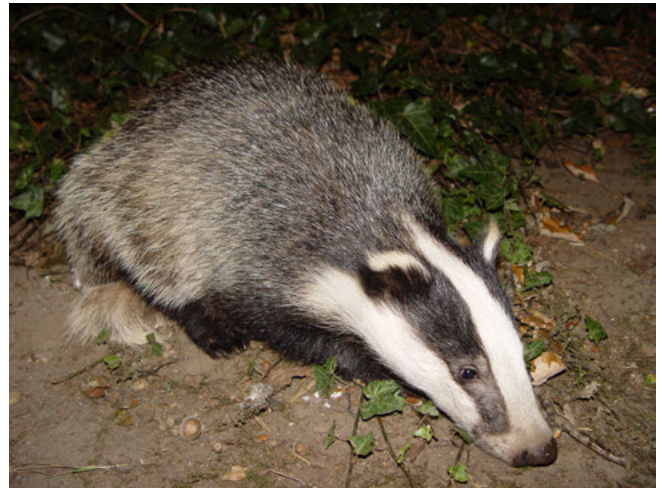
Das ( Meles meles )

Het aantal exemplaren van een beschermde inheemse soort dat in een bepaald geval verstoord wordt, is voor de vraag óf het verbod op verstoring overtreden wordt niet relevant, ook niet indien er geen afbreuk wordt gedaan aan de staat van instandhouding van de soort 2) . Anderzijds hoeft niet iedere handeling die tot gevolg heeft