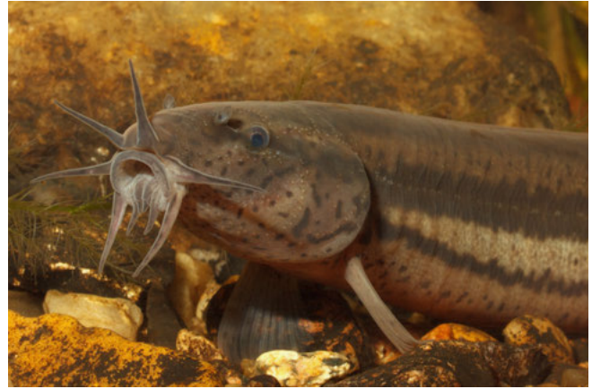
Grote modderkruiper ( Misgurnus fossilis )