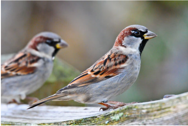
Huismus ( Passer domesticus )