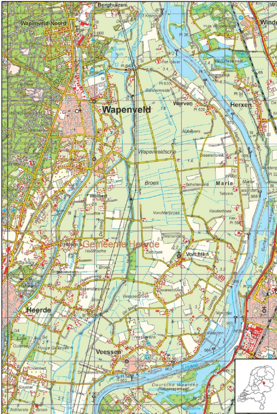
Figuur 5: kaart IJsselvallei

Het glaciaal gevormde komgebied raakte door overstromingen van de IJssel in de loop der tijd gevuld met klei. De hiermee samenhangende slechte afwatering had tot gevolg dat er gedurende een lange periode moerasbos heeft gestaan. De moerassige kom vormde tot de Middeleeuwen een barrière in het landschap en