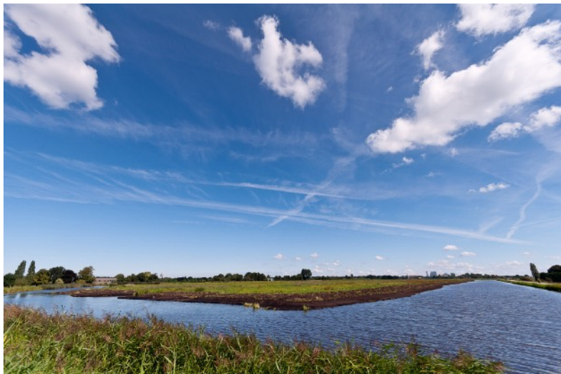
Afbeelding 15: Bovenlanden Amstelland

Geïnterviewden in deze praktijk noemen vooral de polders als historische landschapselementen, of in ieder geval de grotere structuren die het landschap kenmerken. De mensen weten veel van de geschiedenis maar zijn vooral bezig met het behoud van het huidige landschap of