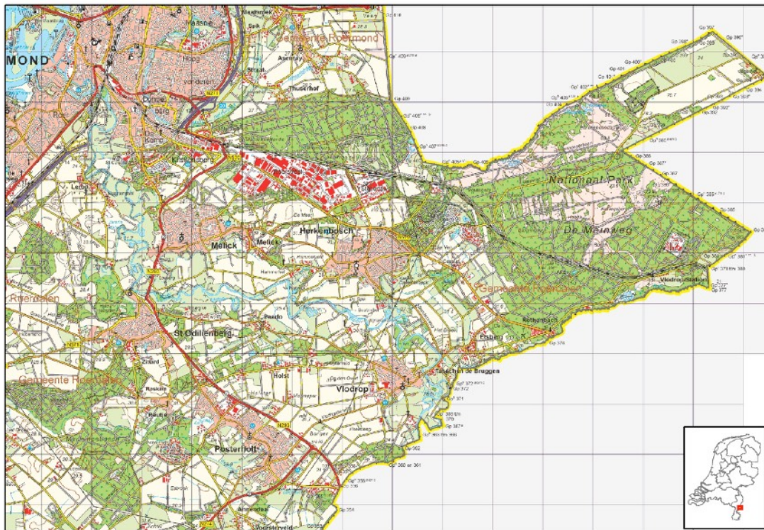
Figuur 3: Kaart Roerstreek

De landschappelijke ontwikkeling in dit gebied is voor een belangrijk deel bepaald door de ligging van het riviertje de Roer en de Vlootbeek. De waterlopen hebben door insnijding gezorgd voor rivierterrassen. De rivierterrassen en de ook aanwezige dekzandruggen zorgen voor een landschap met veel reliëf. Dit reliëf heeft de agrarische ontwikkelingen in belangrijke mate gestuurd.