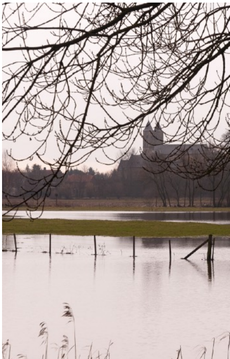
Afbeelding 8: Roer met hoogwater - St. Odiliënberg

"Dat regelen wij voor alle jagers binnen ons werkgebied en binnen onze wildeenheid hebben we ongeveer 100 a 110 actieve jagers. Dus al het papierwerk en vergunningen wat erbij komt, dat regelen wij. Ook ontheffingen, in het [Meinweg] gebied mag je niet met de auto komen, voor de jagers doen wij dan zeg maar bij de gemeente ontheffingen aanvragen".