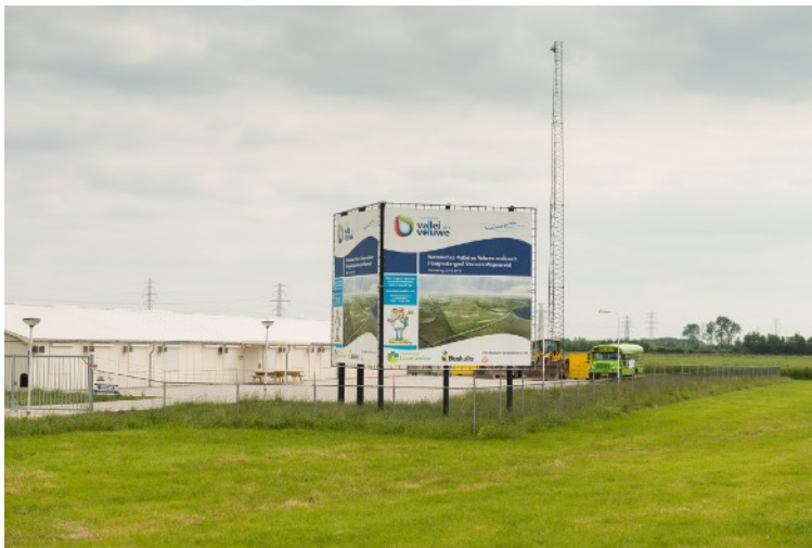
Afbeelding 17: Informatiebord hoogwatergeul

De afgelopen jaren is er onder de bewoners van met name Veessen onrust ontstaan door de aankondiging van de komst van een nieuw aan te leggen tak (bypass) van de IJssel. Hierdoor komt Veessen op een eiland te liggen. Lange tijd was het onzeker of de bypass een permanente rivier zou worden, of een droge bedding die slechts bij hoge standen van de IJssel via een sluis als afvoer dienst doet. Intussen is duidelijk geworden dat het gaat om een zogenaamde hoogwatergeul die naar verwachting slechts incidenteel onder