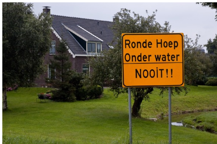
Afbeelding 14: Protest borden langs Amsteldijk

genereren van brede bekendheid om draagvlak te creëren en zo een landschap of object te beschermen. Bij de eerste benadering zijn de activiteiten: veel contacten onderhouden met de gemeente, alle officiële stukken bestuderen, bezwaarschriften schrijven, in beroep gaan en soms