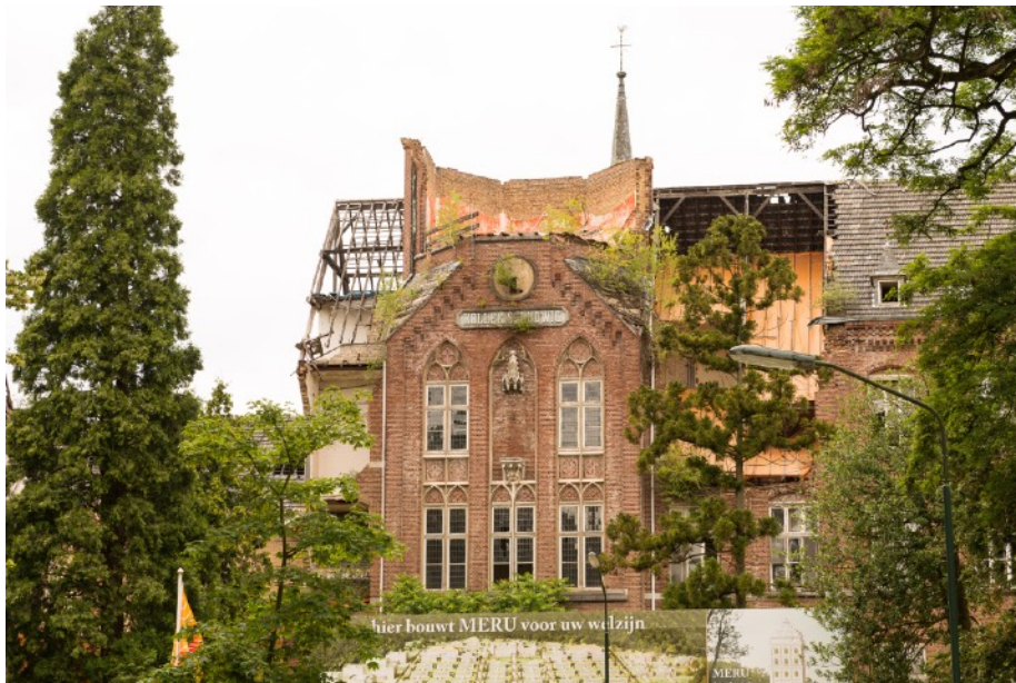
Afbeelding 10: Klooster Sankt Ludwig - Vlodrop Station

Voor de één was het een gevoel dat er iets gebeurde wat niet klopte, zoals het verlenen van een sloopvergunning door de gemeente op vermeende dubieuze gronden. Voor een ander was het een zoektocht naar een hobby. De keuze voor monumenten is sterk verbonden aan een gevoel van streekidentiteit in Limburg. Aandacht gaat, naast het klooster, ook uit naar kruizen, kapellen en kerkhoven. De activiteiten bestaan uit het leveren van inspraak, het doen van onderzoek, vergaderen en het schrijven van artikelen voor kranten en tijdschriften, naast fysiek werk zoals het opknappen van een kerkhof. Inspraak door mensen binnen deze landschapspraktijk heeft eens geleid tot een procedure bij de rechtbank. Hiervoor moesten stukken geschreven worden en er moest veel overlegd worden. Doordat het kloostercomplex de status van rijksmonument heeft gekregen op aanvraag van de betrokkenen in de landschapspraktijk, is er veel landelijke aandacht geweest voor het al dan niet slopen van het gebouw en de procedures die er gevoerd zijn.