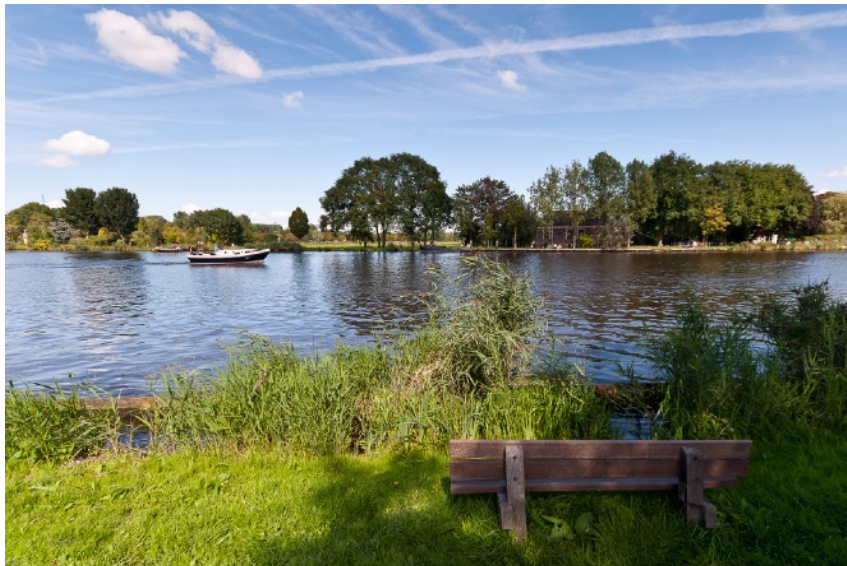
Afbeelding 12: De Amstel

De lokale historische vereniging van de gemeente Nieuwer-Amstel, waar de betrokkenen lid van zijn, coördineert de activiteiten in de landschapspraktijk ‘Verzamelen van historische informatie’. De belangrijkste activiteit van de vereniging is het schrijven van artikelen voor het kwartaalblad ‘Amstelmare’. Voor hun artikelen doen de leden onderzoek in bibliotheken en archieven. Daarnaast ondernemen zij activiteiten zoals het bijwonen van archeologische opgravingen en museumbezoek om meer informatie te vergaren. Het onderwerp van historisch onderzoek verschilt tussen de leden, van prehistorische archeologie tot onderzoek naar de Nieuwe Tijd. Ook het onderwerp van interesse verschilt: er is bijvoorbeeld belangstelling voor genealogisch onderzoek, militaire geschiedenis en landschapsgeschiedenis. Het hoofdmotief is persoonlijke interesse. Andere genoemde motieven zijn de wens om actief te blijven in de maatschappij en de lol om nieuwe informatie te ontdekken, dat een gevoel van detective zijn genereert.