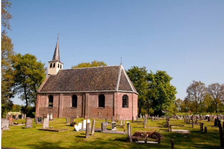
Afbeelding 2: Kerk met kerkhof bij Jubbega-Schurega

elkaar te laten komen en de verzamelingen openbaar te maken. De mensen die gehoor gaven aan deze oproep komen sindsdien regelmatig bij elkaar. Hun activiteiten bestaan vooral uit het bediscussiëren en lezen van historisch materiaal. Daarnaast schrijven zij artikelen voor de lokale krant. Alle deelnemers willen meer weten en