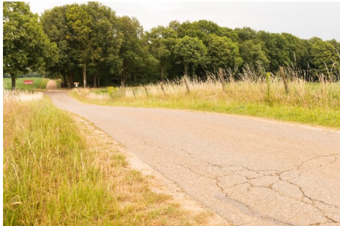
Afbeelding 9: Toegangsweg natuurreservaat

Natuurlijke processen spelen een belangrijkere rol dan culturele processen; aan het menselijk ingrijpen in de natuur wil men zo min mogelijk refereren en men wil het gebied weer terug geven aan de natuur. Vanuit dit beeld worden de ruimtelijke veranderingen in de buurt van het natuurreservaat als behoorlijk groot ervaren. Het gebied ligt aan één zijde