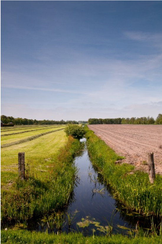
Afbeelding 1: Landschap Tjongervallei

ook om de turf te vervoeren. De Schoterlandse Compagnie groef de Schoterlandse Compagnonsvaart van Heerenveen in oostelijke richting. In 1767 was Wijnjeterp bereikt. De Opsterlandse Compagnonsvaart begon bij Gorredijk. Rond 1700 zou de vaart tot aan de kerk van Lippenhuizen hebben gereikt. Het graven van de vaarten ging sprongsgewijs, al naar gelang er behoefte was aan turf. Dwars op de ontsluitingsvaarten werden zogenaamde wijken gegraven. Ook deze wijken waren voor de afwatering en het transport van turf. De aanlegkosten van een wijk en de afstand die arbeiders over land moesten afleggen naar het water bepaalden de afstand tussen de wijken. Aangezien de afgraving in handen was van commerciële