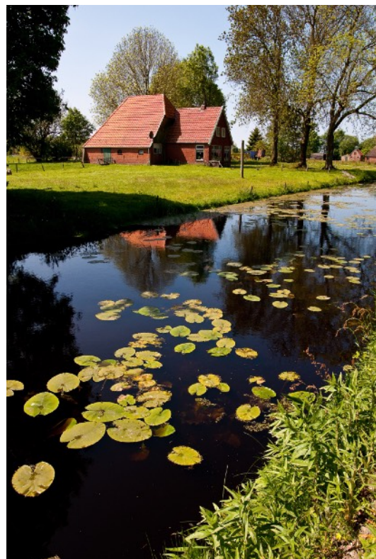
Afbeelding 4: Arbeiderswoning langs Schoterlandse Compagnonsvaart

De landschapspraktijk ‘Natuurbescherming’ houdt zich bezig met het observeren en beschermen van vogelnesten. Daarnaast lezen de natuurbeschermers over het gedrag en de levenscyclus van vogelsoorten. Ze verdiepen zich in juridische wet- en regelgeving om soorten te beschermen. Een belangrijk onderwerp in dit gebied is het zoeken van kievitseieren. Dit is een Friese voorjaarstraditie die de afgelopen jaren landelijk aan strikte banden is gelegd. De administratie van de gevonden eieren is een taak die bij