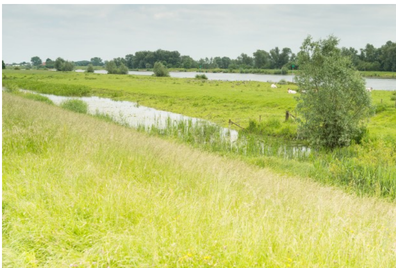
Afbeelding 19: IJssel en uiterwaarden

In het proces heerst veel wantrouwen naar de overheidspartij, in dit geval Rijkswaterstaat; de sfeer tijdens vergaderingen wordt als naar omschreven. De deelnemers in de klankbordgroep merken dat ze harde argumenten nodig