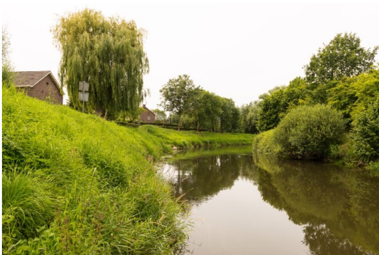
Afbeelding 7: De Roer bij St. Odiliënberg

Sommige deelnemers zijn betrokken geraakt bij verenigingen doordat ze daarvoor gevraagd zijn. Een ander motief is de ontspanning die het brengt, bijvoorbeeld doordat mensen veel tijd in de natuur doorbrengen om te zoeken naar sporen. De sociale aspecten van de