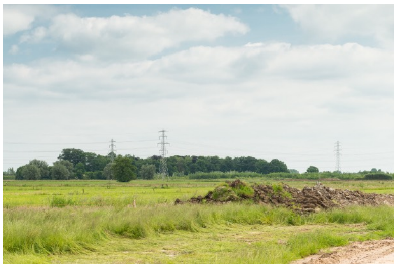
Afbeelding 18: Tracé hoogwatergeul

Twee geïnterviewden zaten in de klankbordgroep van het project 'Hoogwatergeul Veessen'. Deze