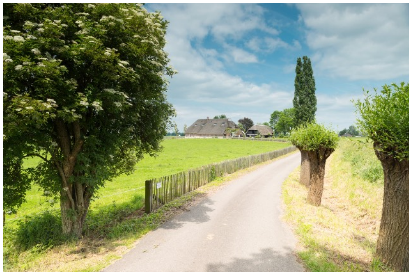
Afbeelding 16: Landschap van de IJsselvallei

(ver-)graven van beken. Zo kon men het stromende water gebruiken door middel van watermolens. In de gemeente Heerde zijn er zo dertien papiermolens en een aantal korenmolens geweest. Het gebied had voornamelijk een agrarische functie. De