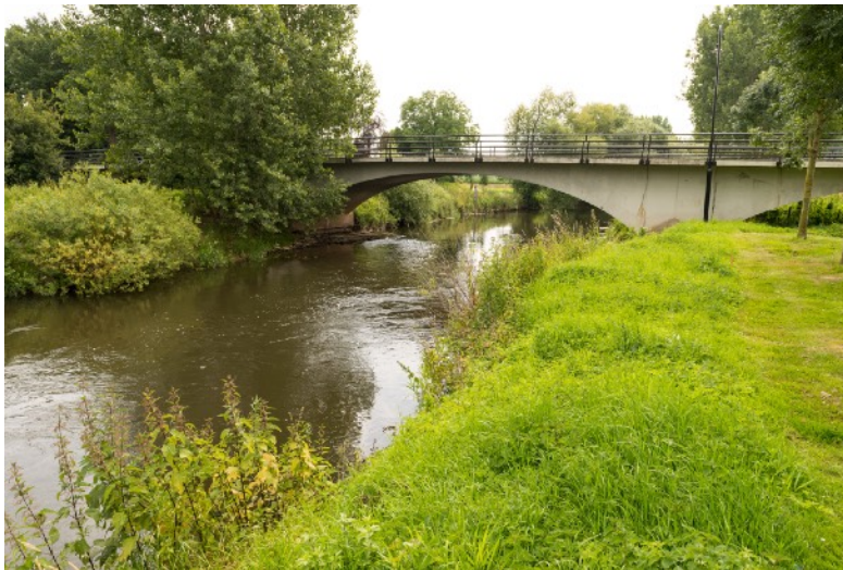
Afbeelding 6: Roer bij Vlodrop

doorwaadbare plaats in de Roer. Posterholt ligt ook op de rand van een beekdal, maar dan die van de Vlootbeek. Het stadje Montfort is waarschijnlijk ontstaan uit de voorburch van de burcht Montfort, die was gebouwd als centrum voor de Gelderse macht in deze streek (Baas et al, 2001). Twee soorten akkerlanden kwamen voor: de individuele kampongtinningen omgeven door houtwallen of heggen en de open akkercomplexen die hier velden worden genoemd. Velden