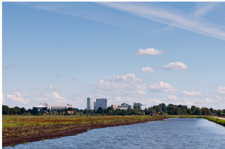
Afbeelding 11: Amstelland aan de rand verstedelijking

akkerbouw. Door de ontwatering en de daarmee samenhangende oxidatie begon de veenbodem snel te dalen. Kaden en dijken werden opgeworpen om water uit het onontgonnen gebied en de rivieren te weren. Hierdoor was