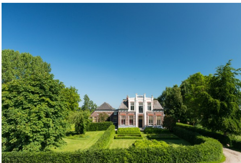
Afbeelding 20: Streekeigen IJsselhoeve

Er zijn vijf bewoners geïnterviewd die niet actief betrokken zijn geweest in het project. Sommigen hebben in het verleden wel wat activiteiten ondernomen in