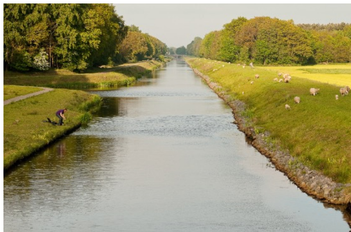
Afbeelding 5: Waterwegen voor watersport

Nieuwbouwplannen vormden een bedreiging voor deze waterwegen. Nadat de dreiging verdwenen was, is de organisatie zich gaan richten op nieuwe ontwikkelingen in het gebied en maakt daarbij gebruik van de waterwegen. De Nije Kompangjons brengt