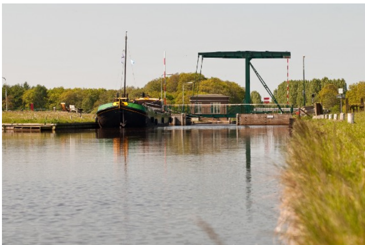
Afbeelding 3: Opsterlandse Compagnonsvaart

De activiteiten in de praktijk 'Educatie van lokale historie' bestaan uit vrijwilligerswerk in een museum en onderwijsprogramma's voor kinderen. De deelnemers organiseren lezingen, excursies, lessen en tentoonstellingen. Daarnaast schrijven ze artikelen over de geschiedenis in de lokale kranten. Eén van de geïnterviewden werkte ook nog mee aan een reconstructieproject voor een veenhut. Het belangrijkste doel van de mensen in deze praktijk is om anderen bekend te maken met het verleden, zodat zij begrijpen van waaruit de gemeenschap ontstaan is, en dat ze het heden waarderen om wat er in het verleden gebeurd is. Deelnemers in deze praktijk zijn bezorgd dat nieuwkomers in de gemeenschap en nieuwe generaties niets weten van het verleden en daarom de historische overblijfselen niet onderhouden. Er is een focus op kinderen, onder verwachting dat een investering in kinderen zich later terug betaalt. Een ander motief om hierin actief te zijn, is maatschappelijke betrokkenheid en de wens om sociaal nuttig bezig te zijn. Historische