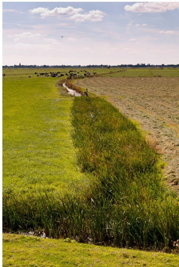
Afbeelding 13: Slotenpatroon polder De Ronde Hoep

De activiteiten die de betrokkenen in de landschapspraktijk ‘Natuurbescherming’ uitvoeren bestaan vooral uit kennisoverdracht aan geïnteresseerden en boeren. De boeren zijn een belangrijke doelgroep omdat het qua natuur in dit gebied vooral gaat om weidevogels die op agrarische gronden leven. Daarnaast is er het veldwerk, dat bestaat uit nesten zoeken en deze beschermen met zogenaamde nestbeschermers. Na het veldwerk is er veel administratief werk, de eieren en nesten worden geregistreerd in een landelijk computersysteem om te bezien of de jonge vogels uit de legfels succesvol groot groeien. De activiteiten passen in een groter netwerk van vrijwilligers die zich bezig houden met weidevogelbeheer. Er zijn drie motieven die pregnant naar voren komen in deze praktijk. Het buiten zijn is een belangrijk motief om bezig te zijn met de weidevogels, ook het beter leren kennen van andere mensen