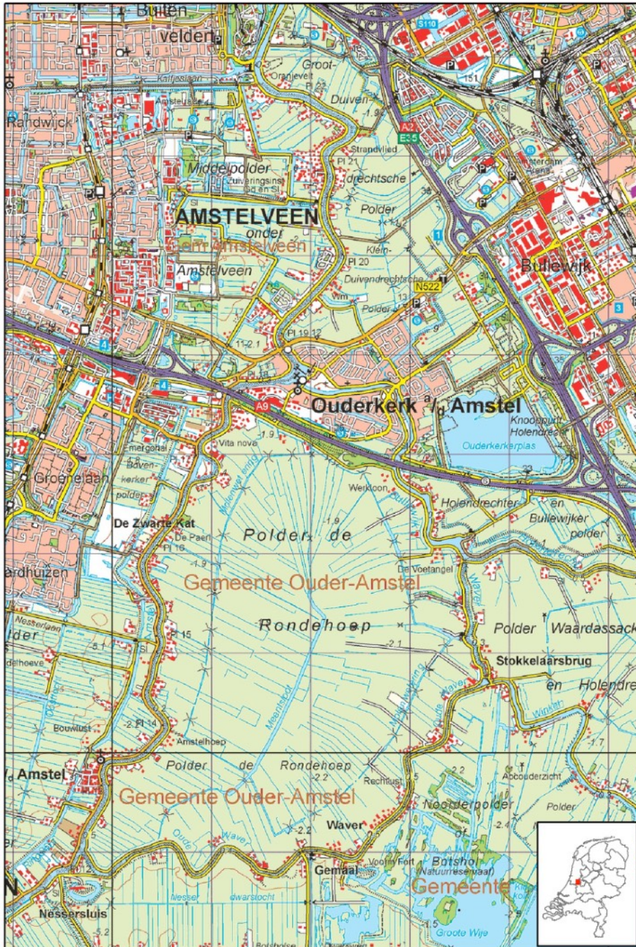
Figuur 4: Kaart Amstelland

delen aan de zuidkant behoren tot de gemeente Nieuwer-Amstel. Het aantal inwoners is circa 11.000 (Centraal Bureau voor de Statistiek, http://www.cbs.nl ).