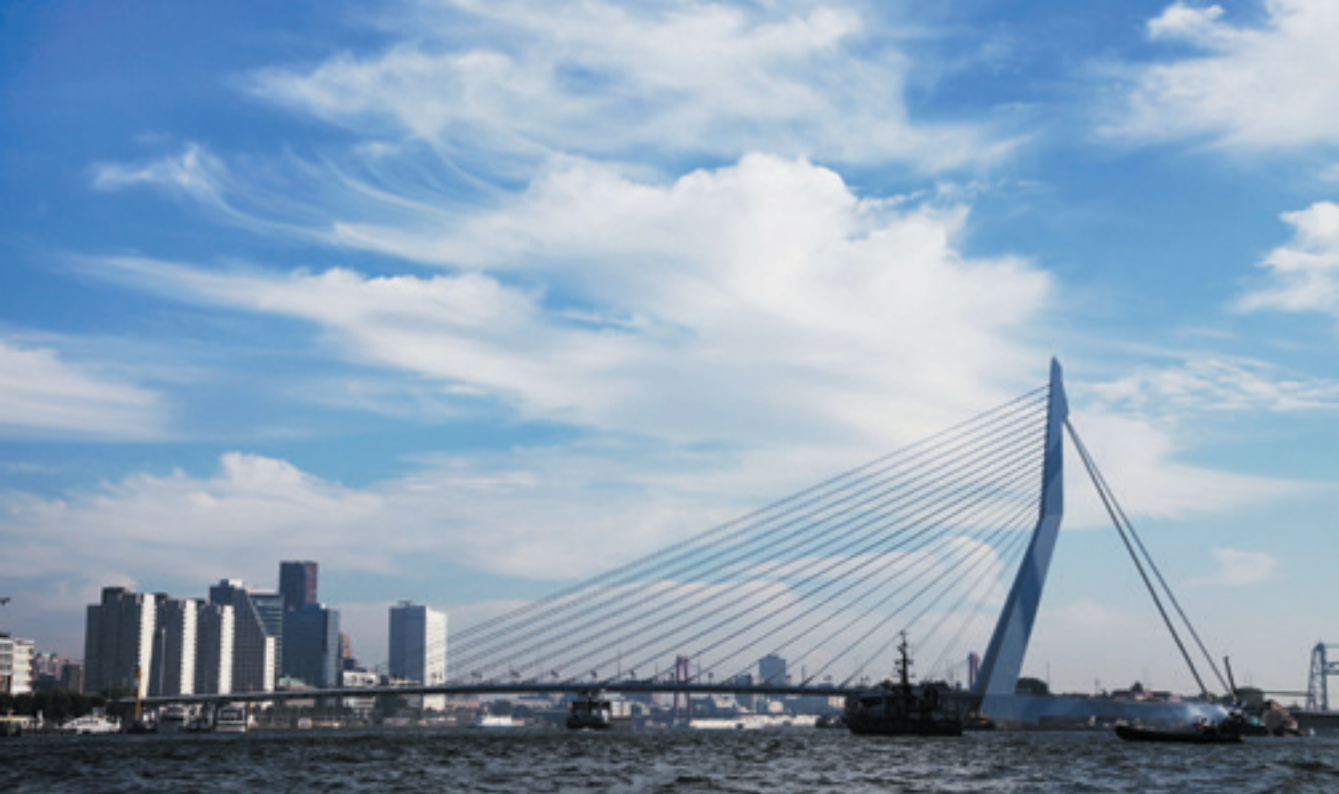
Erasmusbrug: onderdeel architectuurdistrict Rotterdam