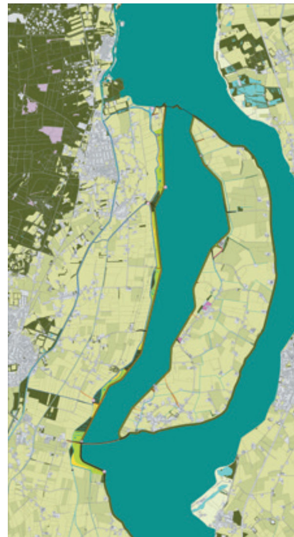
Schets nieuwe situatie

Ik kwam laatst een treffend citaat tegen op de website van het Waterschap Brabantse Delta: "Mede dankzij het terpenplan in de Overdiepse Polder houden ruim vier miljoen bewoners van het bovenstrooms stedelijk gebied droge voeten én kunnen boeren er blijven wonen en werken. De agrarische gebouwen zijn verwijderd en gedeeltelijk teruggeplaatst op terpen langs de dijk. Een project waar de bewoners zelf al in een heel vroeg stadium realiseerden dat het met een beperkter aantal agrariërs doorboeren wel eens de beste oplossing kon zijn voor dit gebied." Dat is een mooi voorbeeld van hoe je samen problemen kan oplossen. Bij wateroverlast moet je elkaar de ruimte geven.