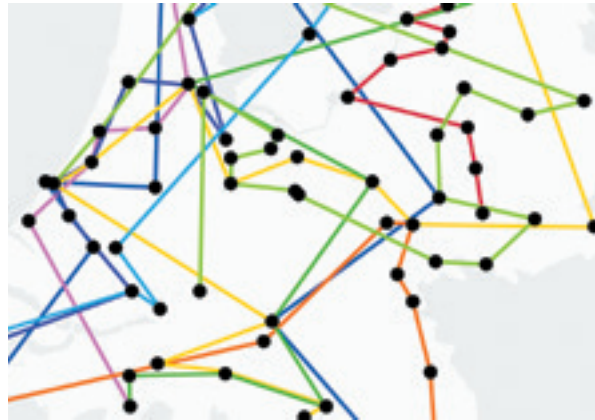
Verhaallijnen als 'stadse metrolijn'