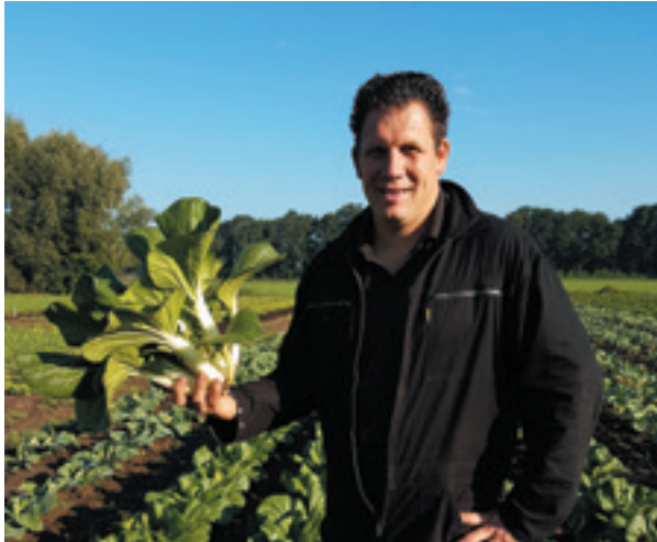
Aan de slag op de Herenboerderij