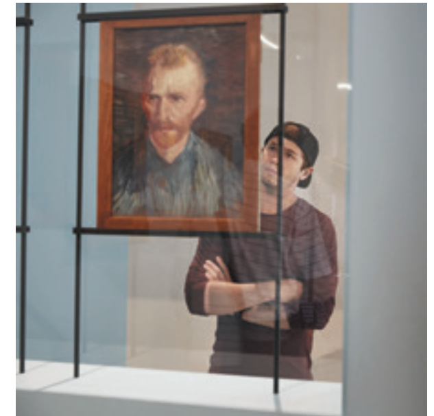
Impressie verhaallijn Van Gogh

Een belangrijk aspect naast de presentatie in districten is de ontwikkeling van verhaallijnen, die als 'stadse metrolijn' worden gevisualiseerd. Het doel is om samenwerking rond de thema's te realiseren en zo een sterker aanbod te ontwikkelen om mensen te verleiden om deze thema's te verkennen. In 2015 is de eerste verhaallijn over Van Gogh met succes geïntroduceerd. Met deze verhaallijn zijn Amsterdam met het Van Gogh Museum, de regio Arnhem met het Kröller-Müller Museum en Brabant, waar hij geboren is en opgroeide, met elkaar verbonden.