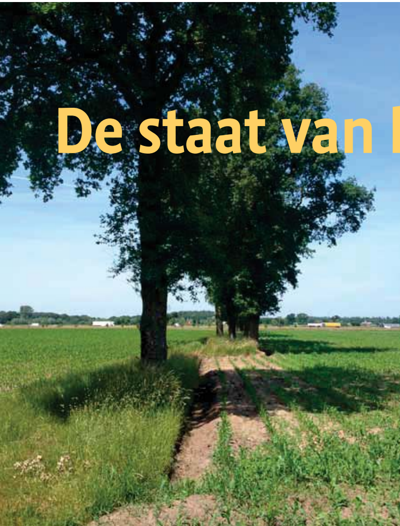
Achteruitgang van landschapselementen is een sluipend proces. De ondergroei is al vrijwel geheel verdwenen en langzaam wordt de gehele houtsingel verdrukt door landbouwbewerking en uitbreiding van de beteelbare oppervlakte.