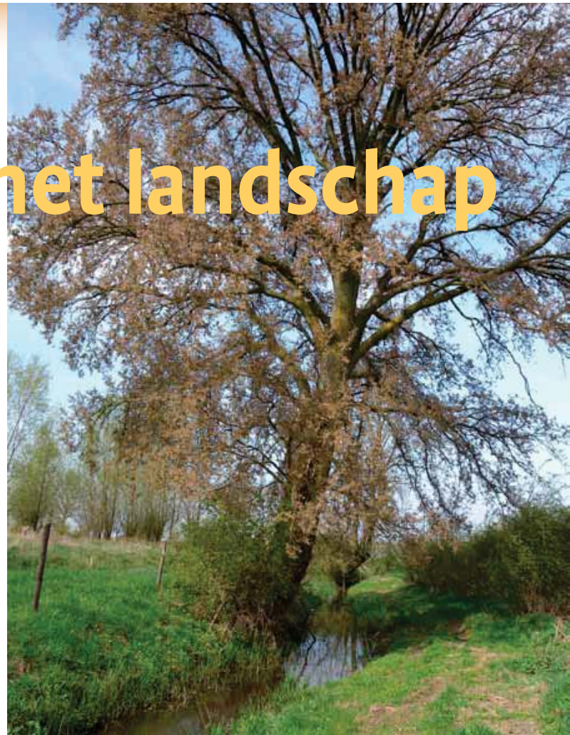
Met vruchten beladen fladderiep bij de Gebrande Kamp, Maasheggenheid, Limburg.