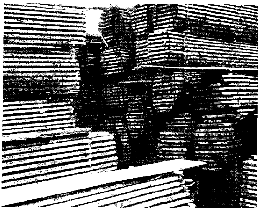
Afb. 2. Deskundig gestapeld gezaagd inlands hout.

middel van wetenschappelijk onderzoek (afdeling Bosexploitatie van de Landbouwhogeschool, Houtinstituut T.N.O.) objectief en duidelijk te worden vastgesteld en daarna via een goed georganiseerde voorlichting bekend te worden gemaakt aan consument, handel en producent. Vermoedelijk is er dan ook wel plaats voor een industriële integratie, zoals deze in Nieuw-Zeeland (Entrican 1957) reeds bestaat en waardoor het mogelijk is een partij hout als het ware aan de lopende band langs verschillende industrieën te voeren, waarbij elke industriële ondernemer de hem passende sortimenten uit de partij haalt. De industriële integratie is overigens niet een specifiek douglasvraagstuk. Het past eerder in de reeks van algemene maatregelen, die de economie in de bosbouw kunnen bevorderen en waarop ik in een derde artikel over de bosbouwconomie hoop terug te komen.