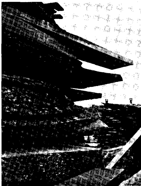
Afb. 1. Slecht gestapeld en krom getrokken gezaagd inlands hout.

lukt dit met een redelijk scherpe beitel meestal vrij aardig. Voor grenen- en vooral douglashout is echter een vlijmscherp gereedschap een eerste voorwaarde om bij het schaven geen narigheden te krijgen. Met vroegtijdige deskundige voorlichting op dit gebied zal men vooroordelen moeten voorkomen, want zo ergens dan geldt zeker bij vooroordelen het spreekwoord: voorkomen is beter dan genezen.