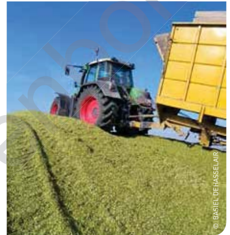
De maïsoopbrengst verschilt van regio tot regio, maar op veel bedrijven valt hij tegen.