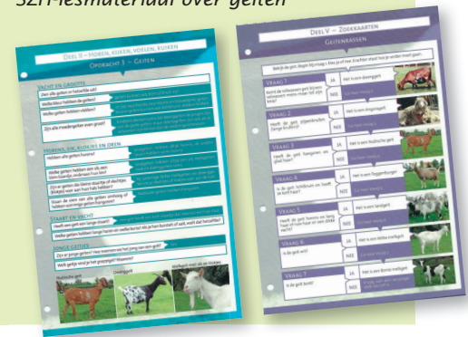
Kleurplaat (Bonte) geiten