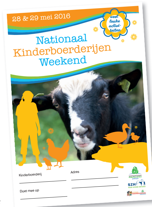
Poster met Bonte geit voor het kinderboerderijenweekend