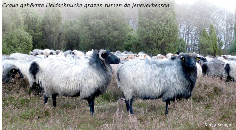
Graue gehörnte Heidschnucke grazen tussen de jeneverbessen

Eigenlijk is deze geschiedenis voor grote delen van Noordwest-Europa – met regionale accenten – goed vergelijkbaar. In de Duitse deelstaat Nedersaksen is men zich sterk bewust van deze geschiedenis en van de waarde daarvan. Het traditionele