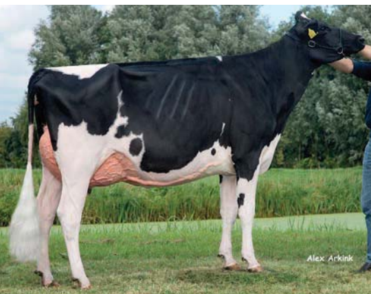
Bons-Holsteins Koba 219 (v. Lauthority), kampioene zwartbont vaarzen Prod.: 2.01 149 6130 3,65 3,08 lw 114 l.l.