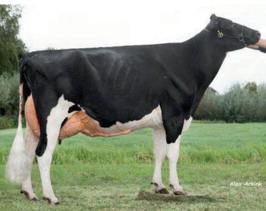
Geertje 567 (v. Windbrook), kampioene zwartbont midden Prod.: 2.05 404 13.356 4,29 3,15 lw 114