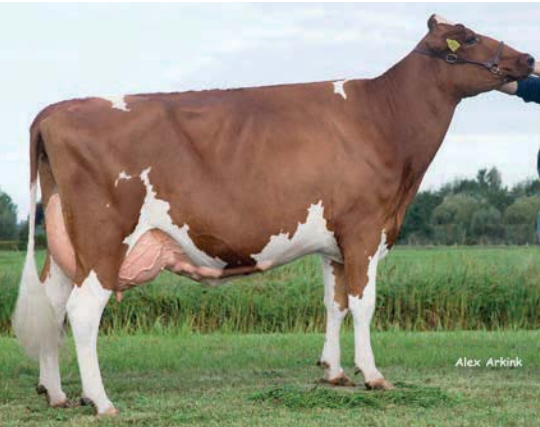
Welland Sien 2 (v. Pleasure), kampioene roodbont jong Prod.: 2.02 381 11.321 3,56 3,55 lw 112