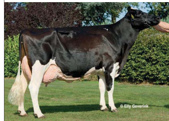
Pleun (v. Zabing), kamp. senioren zwart Prod.: 4.07 359 12.229 4,23 3,40 lw 105

66. De sterke en krachtig gebouwde Mascoldochter versloeg haar stalgenote Nijkamp Leonoor 12 (v. Enterprise), de oudste koe van de keuring. Maar van Pleun winnen bleek een brug te ver. Met haar breed en hoog opgehangen uier, fraaie overgangen en de goed geplaatste draai-er won ze in Laren de seniorentitel. |