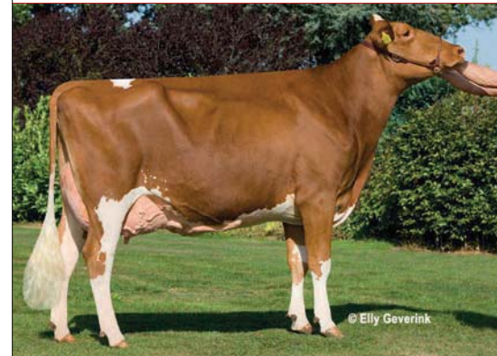
Geertje 409 (v. Secure), kamp. midden rood Prod.: 2.00 494 12.079 4,24 3,62 lw 106