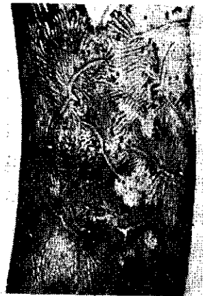
Fig. 1. Schurftige plek waarin wintergangen bij een taklitteken op een gezonde twijg.

Two-armed mothergalleries with larval tunnels and pupal chambers. (Bark has been removed).