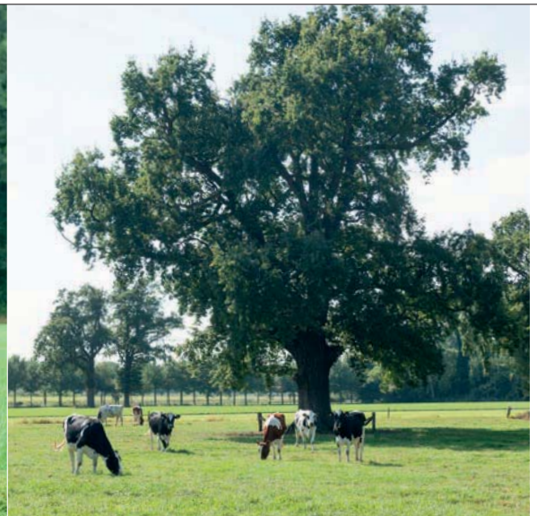
Oelhorst AK Froukje 428 (v. Chevrolet). Prod.: 2.03 133 6030 3,34 3,14 l.l. Door de vele bomen is de verkaveling niet ideaal